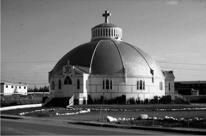
Anglicaanse kerk in Inuvik

Ik betreed het gloednieuwe strak modern ingerichte kantoorgebouw van het Department Mines and Resources en vraag beleefd naar topografische kaarten van het Yukonterritorium.