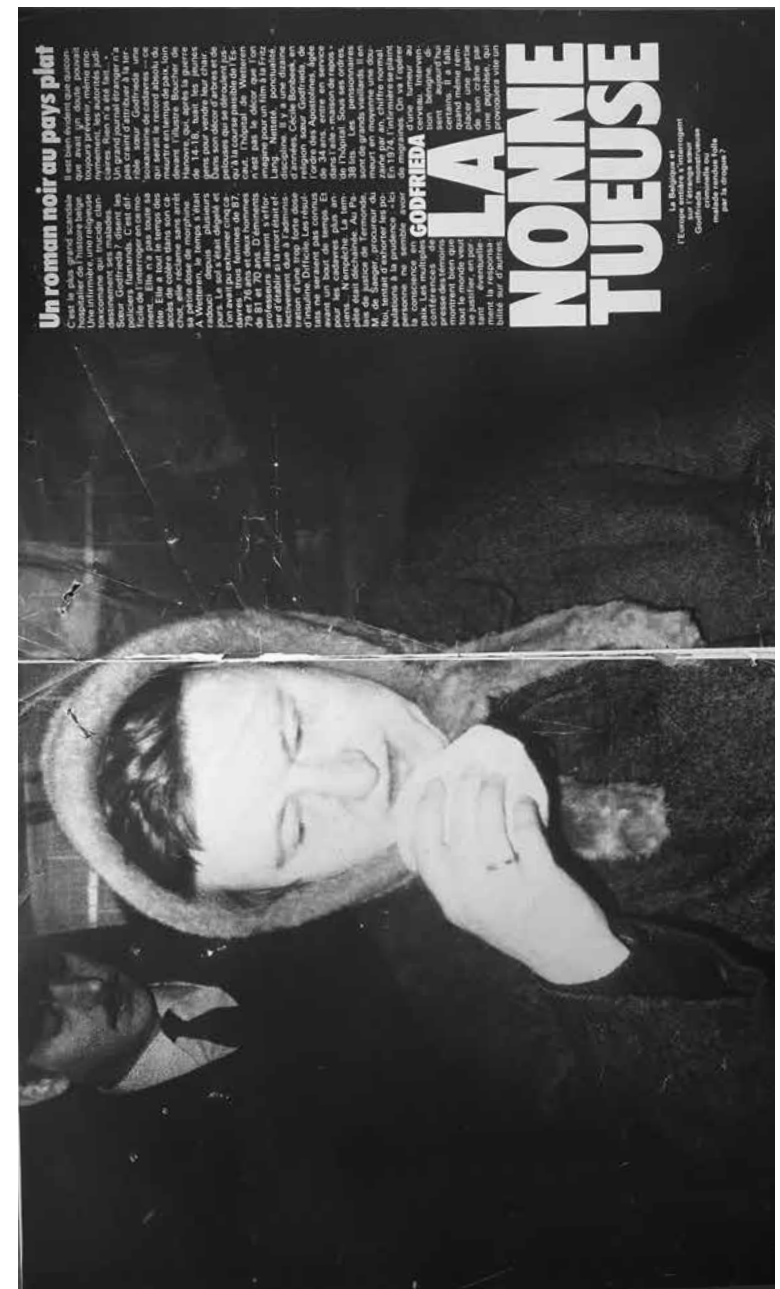
Paris Match publiceert op 10 maart 1978 het artikel 'La nonne tueuse'.