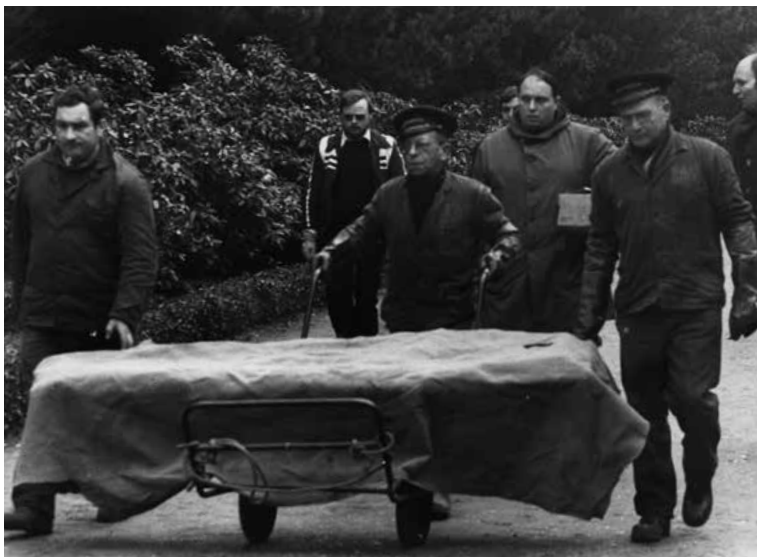
Een van de opgegraven kisten wordt weggevoerd.

Valium en Seresta teruggevonden. De gerechtsarts stelt ook vast dat hij prostaatkanker had. Valium en Seresta worden ook aangetroffen bij Irma De Backer. Maar belangrijker: bij haar is er ook sprake van sporen van insuline.