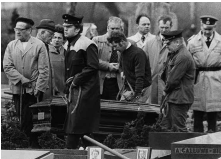
De eerste opgegraven kist wordt naar het dodenhuisje gebracht, waar de autopsie zal plaatsvinden.