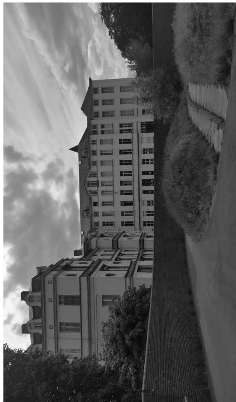
Het voormalige Wetterse kloostergebouw anno 2023.

Is het daarom dat de drie vrouwen hun heil zoeken bij De Corte? De jonge huisarts heeft alvast de reputatie zich niet te veel aan te trekken van de gevestigde macht en de katholieke Kerk. Sommigen noemen hem eigenzinnig, anderen een keikop. Ook het woord ‘querulant’ valt al wel eens als het over De Corte gaat.