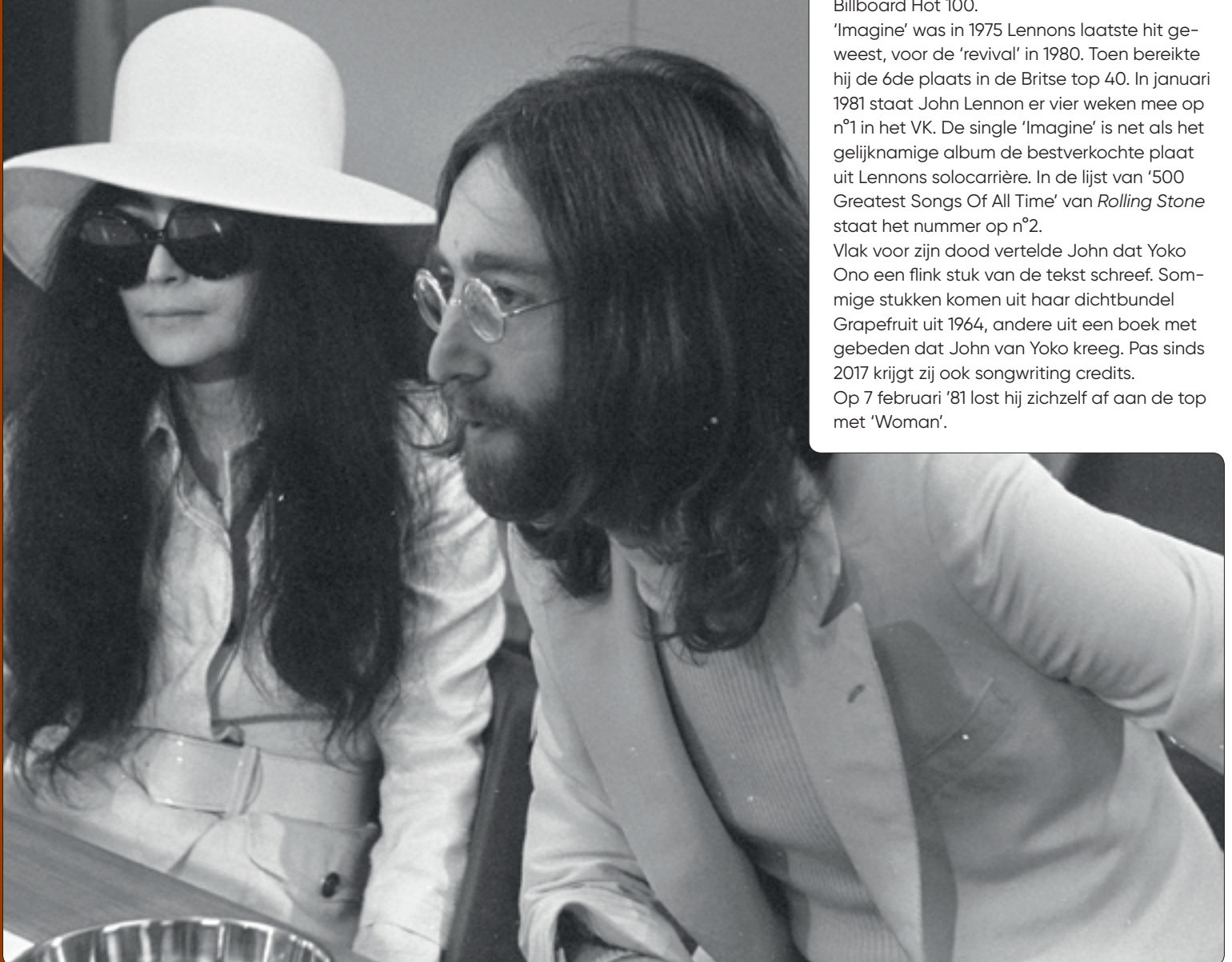
John Lennon en echtgenote Yoko Ono vertrekken van Schiphol naar Wenen in de vertrekhal.

Op 7 februari '81 lost hij zichzelf af aan de top met 'Woman'.