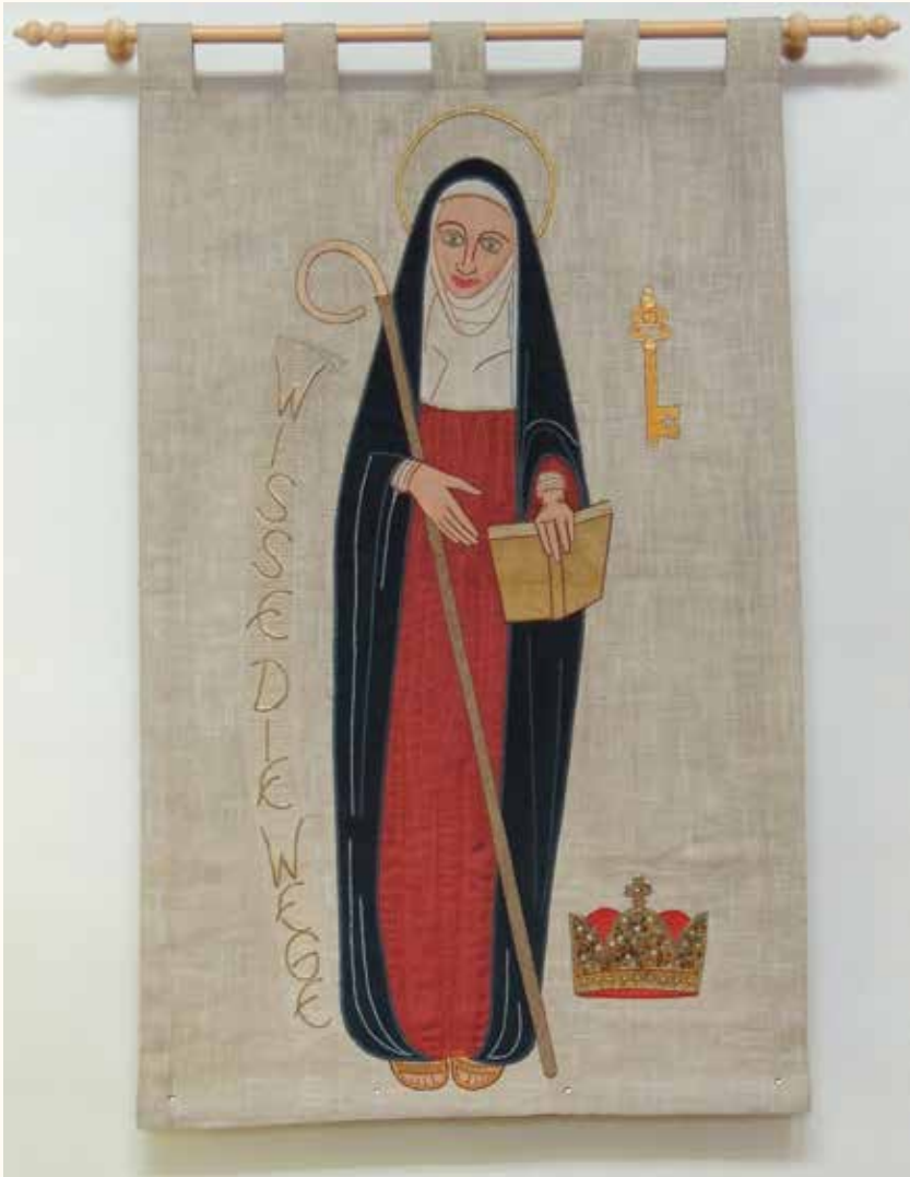
HILDEGARD VON BINGEN. WANDTAPIJT IN DE HEILIG-GEIST-KIRCHE TE RIEDERWALD (FRANKFURT AM MAIN).