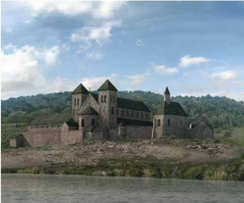
VISUALISERING VAN HET KLOSTER RUPERTSBERG IN HET MUSEUM AM STROM, BINGEN AM RHEIN.

Haar adellijke ouders, Hildebert en Mechthild von Bermersheim, droegen de achtjarige Hildegard voor haar opvoeding in 1106 over aan Jutta von Sponheim (1091-1136), de abdis van Disibodenberg. Deze leerde haar onder meer schrijven, psalmen zingen en harp spelen. Op veertienjarige leeftijd deed Hildegard al haar intrede in de benedictinessenabdij Kloster Disibodenberg. Na de vroegtijdige dood van Jutta – ze was slechts 45 jaar – kreeg Hildegard meteen de leiding over haar kloostergemeenschap. Later stichtte ze in Bingen am Rhein het Kloster Rupertsberg aan de Nahe, een zijrivier van de Rijn. Daarna stichtte ze aan de nabijgelegen Rijnsoever een tweede abdij: Kloster Eibingen (bij Rüdesheim).