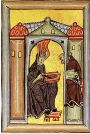
HILDEGARD VON BINGEN ONTVANGT EEN GODDELIJKE INGEVING EN GEEFT DEZE DOOR AAN EEN SCHRIFTGELEERDE. MINIATUUR UIT DE RUPERTSBERG SCIVIAS-CODEX (CA. 1151).

Paus Eugenius III (1087-1153) haar mystieke gaven en gaf hij Hildegard niet alleen een officiële toestemming om haar visioenen op te schrijven, maar ook zelfs om er met gezag over te spreken in het openbaar, iets wat een vrouw in die tijd nog niet overkomen was. Al spoedig kreeg ze bijnamen als ‘Duitse profetes’ en ‘Sybille van de Rijn’.