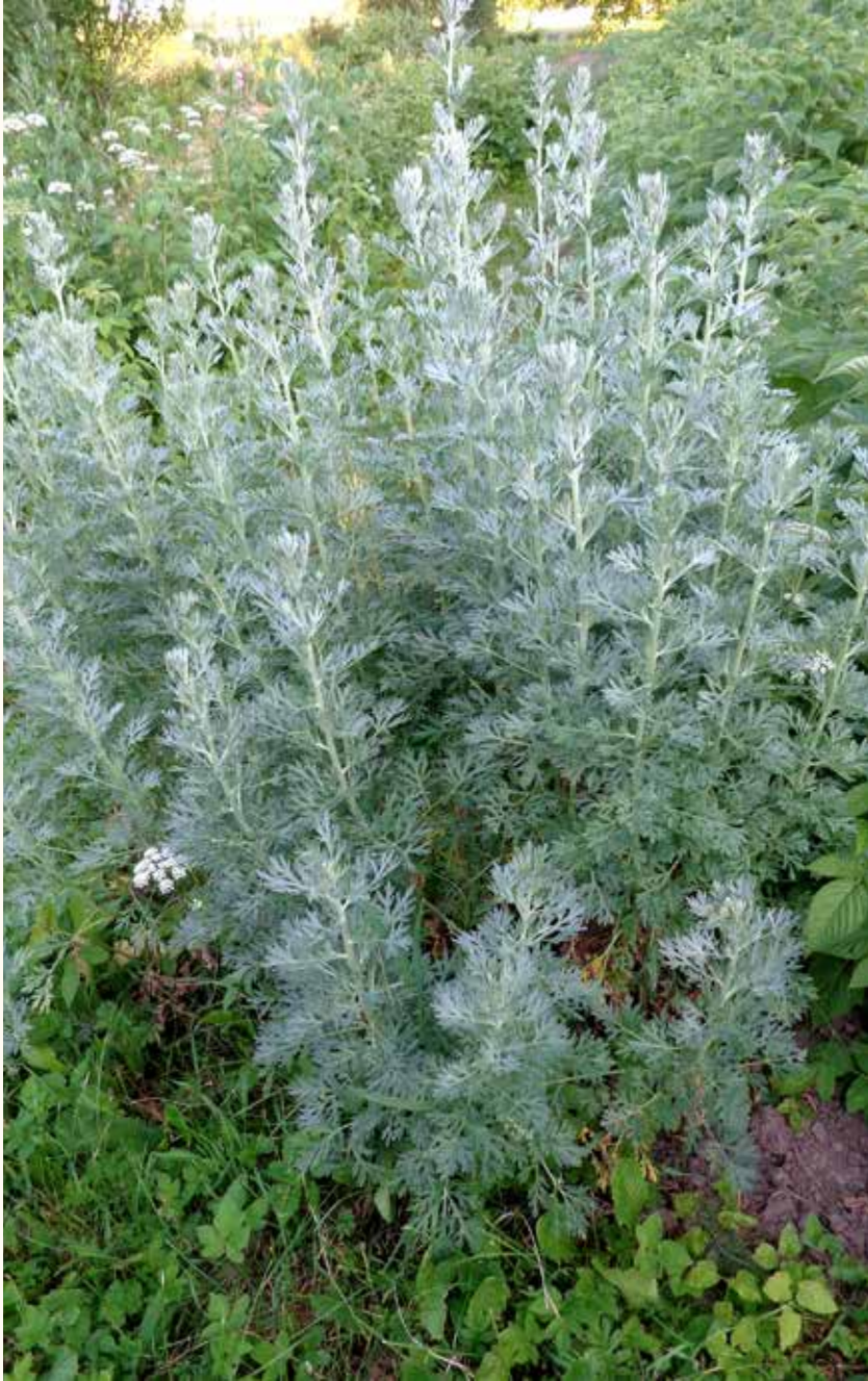
ABSINTALSEM IN BLAD.