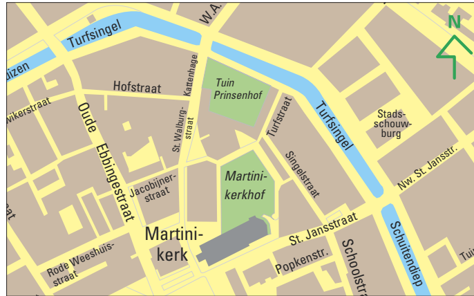
Afb. 3 Ligging van de tuin van het Prinsenhof in de binnenstad van Groningen.

Tussen Stadhoudershof en de tuin ligt een bordes dat afgesloten wordt door een lage muur. De breedte van het bordes is ongeveer de breedte geweest van de oude "stadwech" die onder langs de stadsmuur liep. Heel toepasselijk Achter de muur genoemd,