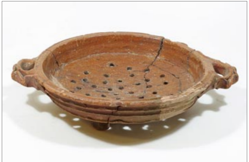
Afb. 10 Dit vergiet, breedte circa 25 cm, dateert uit het begin van de 17de eeuw. Het is van lichtrood bakkend aardewerk, voorzien van loodglazuur.