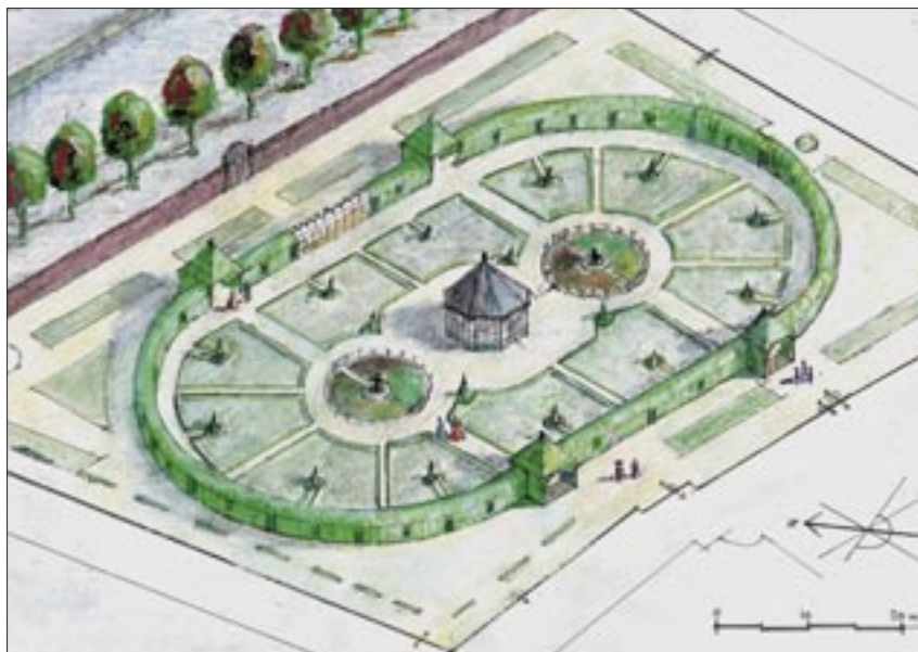
Afb. 14 Schematische (isometrische) impressie van de tuin van het Prinsenhof in de tweede helft van de 17de eeuw en de 18de eeuw. Tekening Hans Vrijer.

“Broeibakken waren onontbeerlijk voor de teelt van meloenen, een geliefde vrucht aan het hof. Tuinproducten zoals meloenen vormden aantrekkelijke geschenken. Een over-