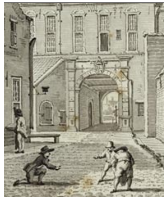
Afb. 18 Boven de Gardepoort is vaag het wapen van Stad en Ommelanden te zien.