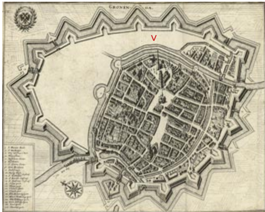
Afb. 6 Plattegrond uit omstreeks 1650 met de stadsuitleg van Groningen begin 17de eeuw . Aan de oost- en noordoostzijde van de stad zijn de dubbele grachten te zien (zie pijl) waar, na demping daarvan, de Stadhouderstuin aangelegd kon worden.

Bij zijn onderzoek naar gegevens over het Stadhoudershof kwam hij besluiten tegen over deze tuin in de Resoluties der Gedeputeerde Staten en in de Statenarchieven van Groningen. Wat de tuin betreft: te beginnen vanaf circa 1626 toen de “gaerde” op verzoek van stadhouder Ernst Casimir werd aangelegd. Een enkeling zoals Charles Ogier – een Franse gezantschapssecretaris – schreef in 1636 zijn ervaringen over zijn bezoek aan de Prinsentuin in zijn dagboek-