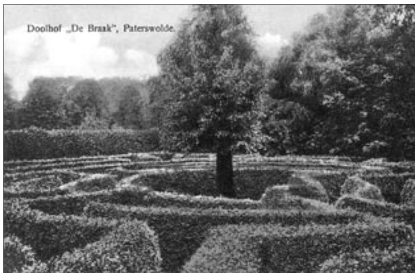
Afb. 16 Het doolhof van De Braak in Paterswolde in 1914. Zo zou het doolhof in de Prinsentuin er in de achttiende eeuw, met lage geknipte hagen, uitgezien kunnen hebben.

E nige schuiten turfmot of turf-molm worden in 1713 aangevoerd ter aanvulling van de parterres in de tuin. Het onderhoud van de “Stadhouderstuin” wordt voor drie jaar uitbesteed; later om de zes jaar.