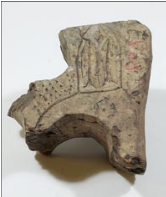
Afb. 9 Fragment van een middeleeuwse kandelaar uit (15)64.