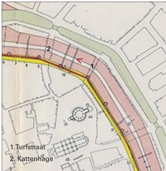
Afb. 7 De grachten (roze) die Van Giffen aantrof. Bij de pijl de twee proefsleuven. 5