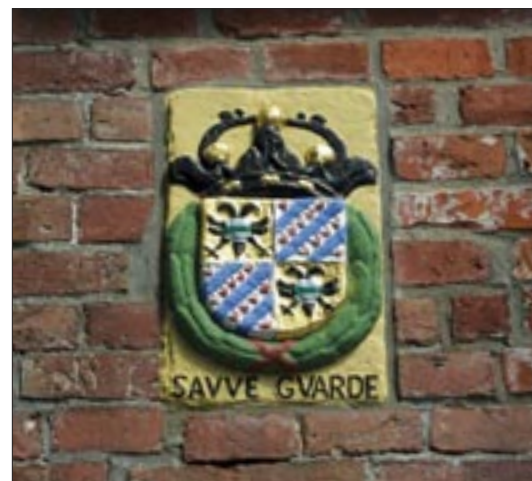
Afb. 17 Het wapen van Stad en Ommelanden op een 17de-eeuws gevelsteentje bij de Westerhavenstraat 24.