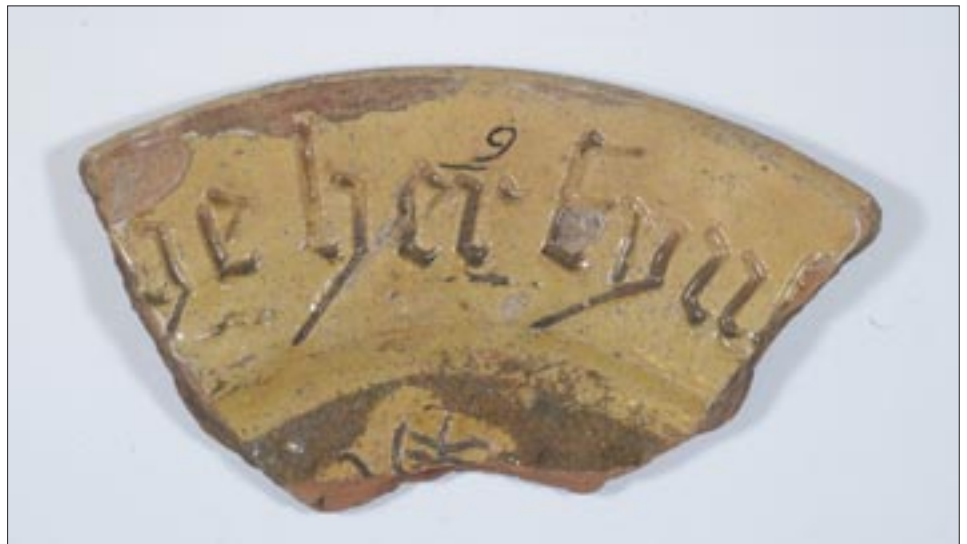
Afb. 8 Scherf van een bordfragment rond 1500. De tekst is waarschijnlijk te lezen als: “[...] ge her byn [...]” met een vermoedelijk religieuze strekking.