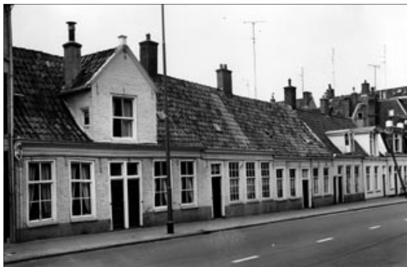
Afb. 11 Kattenhage westzijde. Foto uit 1967. De verzakkingen ter plekke van de voormalige stadsgrachten zijn (nu nog) goed te zien.