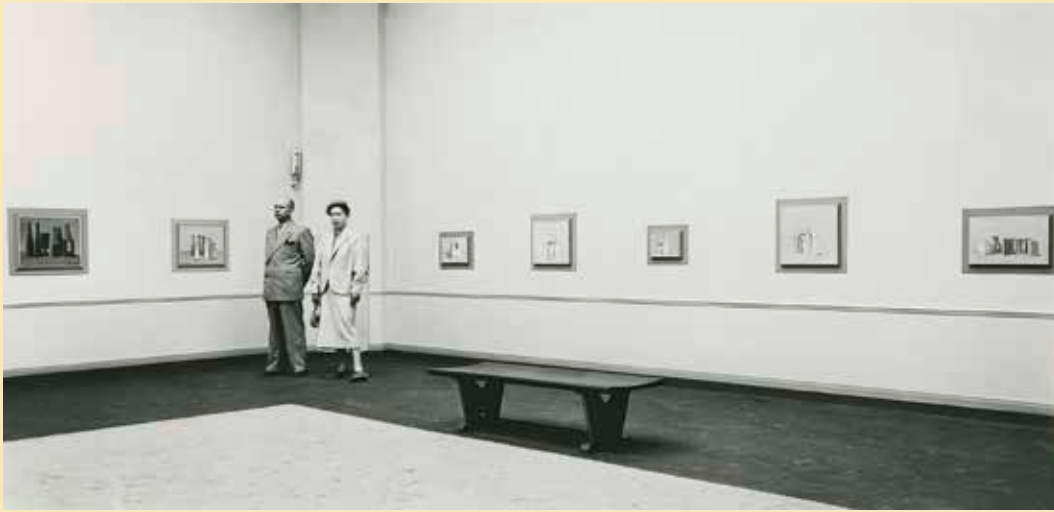
Haags Gemeentemuseum, twee zaaloverzichten van de grote Morandi-tentoonstelling in 1954