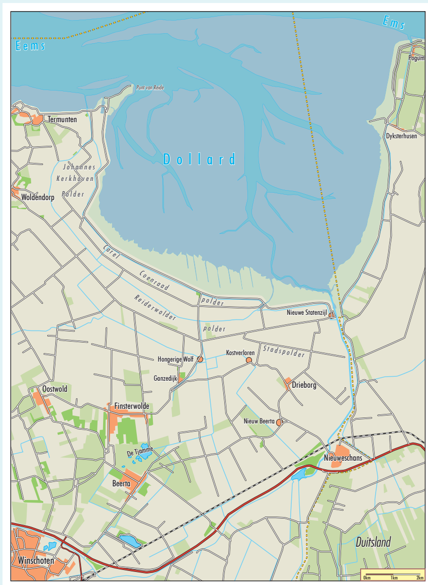
Dollard en omliggende polders