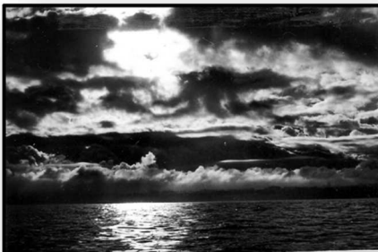
Wilde nacht langs Quessant

analy six' meldt de Navtex opgewekt. Nee, alles gaat niet echt gemakkelijk.