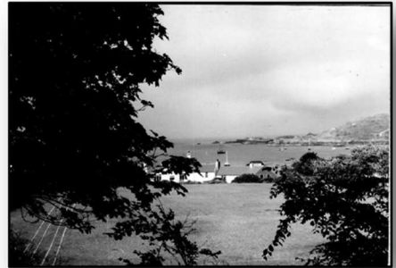
Ankerbaai van Alderney

Wind NW-4. De geweldige stromen bij 'Cap de la Hague' en vooral die in de beruchte 'race', sleuren ons daarna in iets meer dan drie uur naar het 25 mijl verderop gelegen kanaaleiland Alderney. Een geweldige sensatie!. Voor tien pond mag je hier de eerste nacht aan een mooring liggen. De tweede nacht is dan gratis. De boot naar de wal