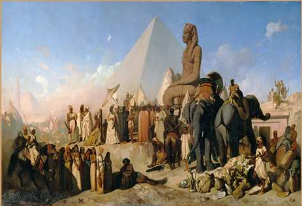
Een schilderij van een denkbeeldige ontmoeting tussen Cambyses II en Psamtik III.

Cambyses II was de tweede koning der koningen van het Achaemenidische rijk Hij was de zoon en opvolger van Cyrus de Grote omstreeks 550 - 530 v.Chr. En zijn moeder was Cassandane.