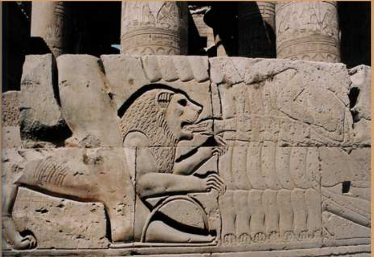
De leeuw die staat afgebeeld in de Kom-Ombo tempel in het gedeelte van Horus de Oudere

In januari 2015 werden nieuwe ontdekkingen op de site aangekondigd die de identificatie ervan als het fort van Tjaru bevestigden.