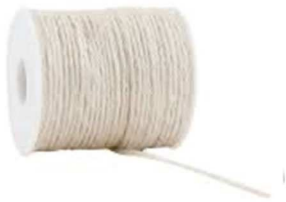
Stuk touw met een lengte van 37,5 cm