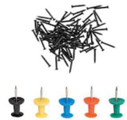
Klein spijkertje of punaise