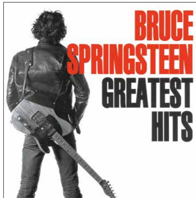
Het album Greatest Hits van Springsteen.

Deze Best Of is voor Bruce Springsteen een gelegenheid voor een reünie met de E Street Band en ze werken opnieuw samen aan het opnemen van vier van deze vijf nieuwe nummers. De muzikanten speelden immers niet mee op 'Streets of Philadelphia'. Het is dan ook in een sfeer van een gedeelde en aanstekelijke vreugde dat de leden van de E Street Band Bruce terugzien. De reünie is slechts tijdelijk... maar zou deze eenmalige samenwerking een voorbode kunnen zijn van een hereniging enkele jaren later?