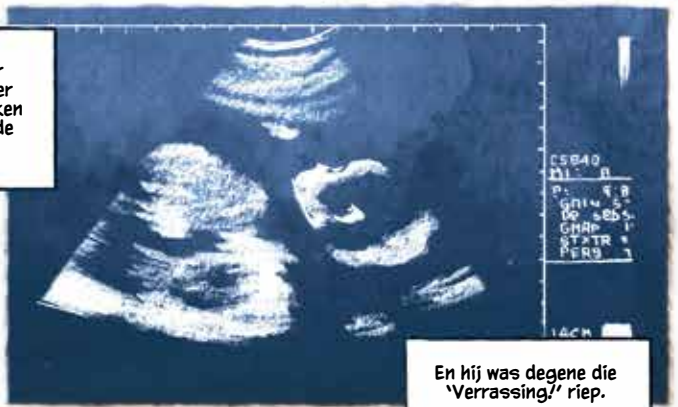
En hij was degene die 'Verrassing!' riep.