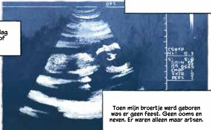
Toen mijn broertje werd geboren was er geen feest. Geen ooms en neven. Er waren alleen maar artsen.