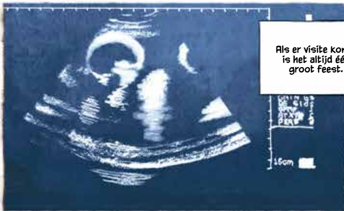
Als er visite komt, is het altijd één groot feest.