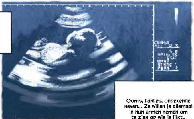
Ooms, tantes, onbekende neven... Ze willen je allemaal in hun armen nemen om te zien op wie je lijkt..