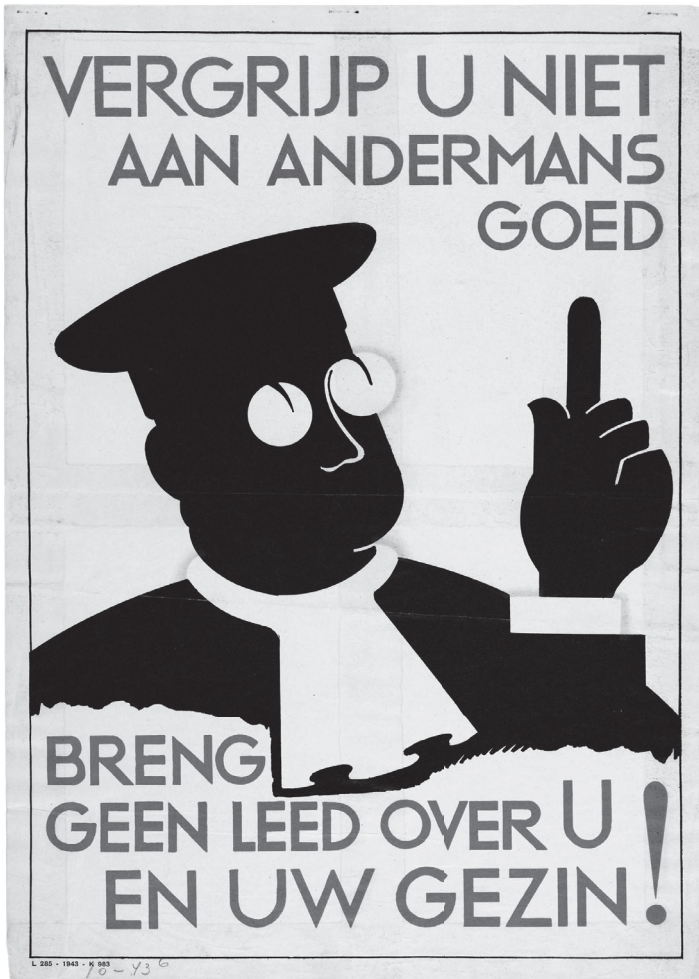
Met dit affiche waarschuwde de PTT in 1943 tegen diefstal

hun spullen in gebruik namen, werd dat weliswaar als ongewenst beschouwd, maar het leidde tijdens en na de oorlog zelden tot strafrechtelijke vervolging. Uit hoofdstuk 4 blijkt dat de positie waarin Joden door de vervolging terecht kwamen hen bijzonder kwetsbaar maakte om slachtoffers te worden van (vermogens-) criminaliteit.