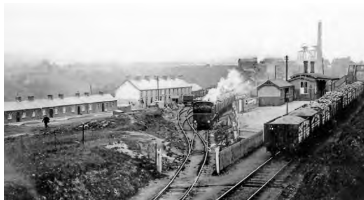
Een foto van een aantal jaren later van de kolenmijn in Wales. Op het perronnetje een stationbord met Seven Sisters. Links de zeer kleine arbeiders woningen en de grotere woningen voor het hogere personeel.