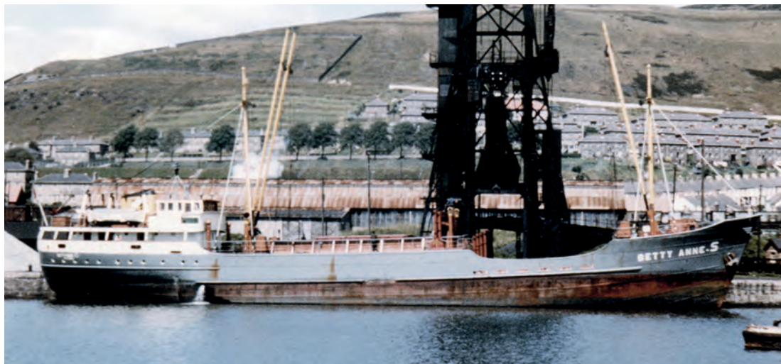
De 'Betty Anne-S' van de RKC onder de kolentip in Swansea in 1963. Schepen van de RKC waren jarenlang geregelde klanten in deze haven.