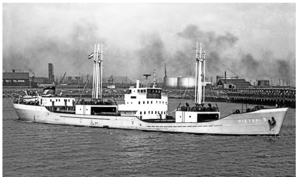
De 'Pieter-S' vertrekt uit Swansea met een lading kolen bestemd voor de Waalhaven in Rotterdam. De witte dekhuisen (masthuis) dienden om de stalen Mac-Gregor rolluiken bij een geopend ruim onder te brengen.