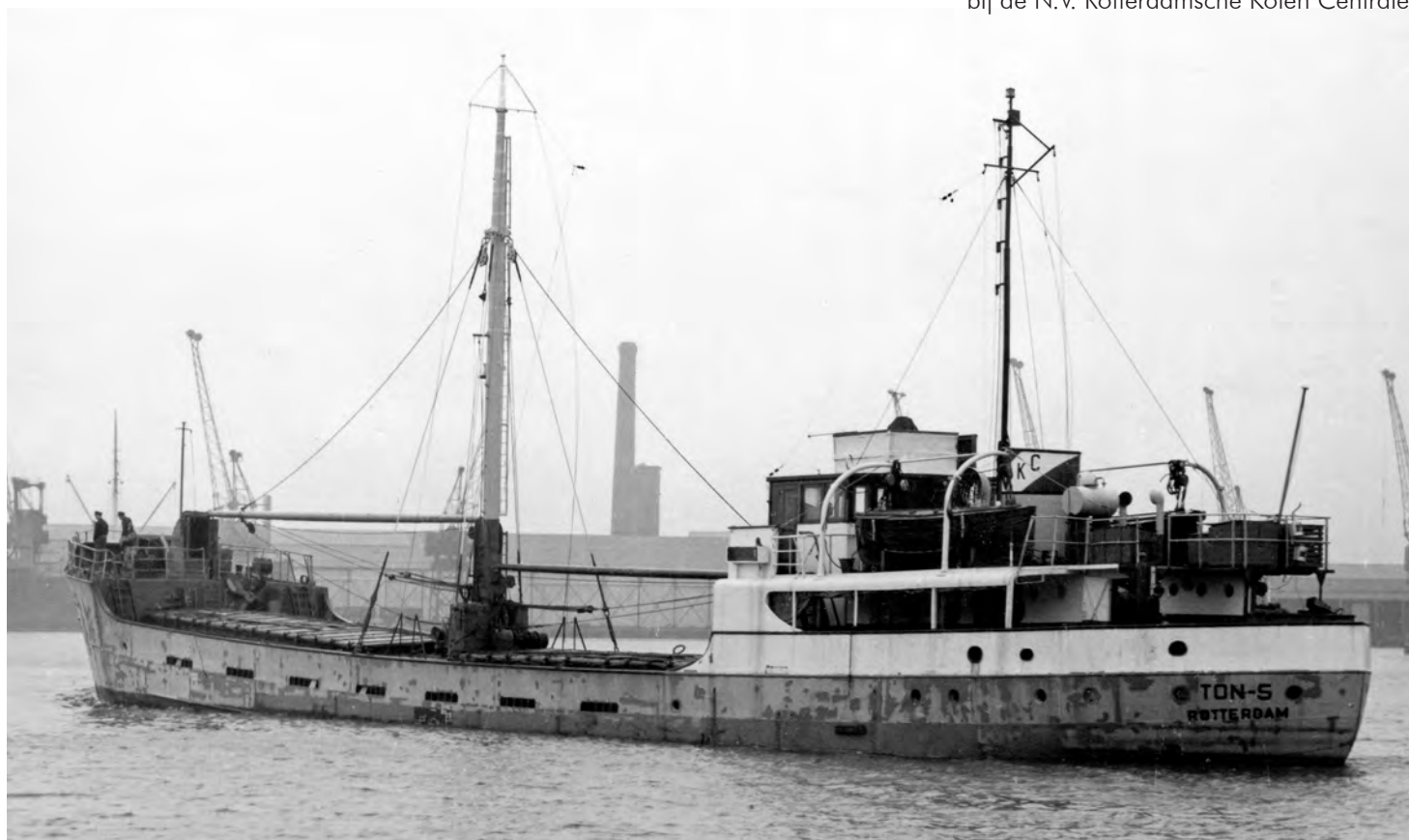
Complete wagonladingen antraciet werden gestort in het ruim van de 'Ton-S'. Bij vertrek werd het hele schip schoon gespoten.

dat onder de kolentip in Swansea complete wagonladingen antraciet werden gestort in het ruim. Het schip zag er niet uit door al het kolengruis en het was alle hens aan dek om de coaster schoon te spuiten, vaak meteen al na vertrek. Alle genoemde kolensoorten waren te koop bij de N.V. Rotterdamsche Kolen Centrale