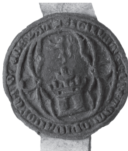
Afb. 1.2 Zegel van Oudewater met dubbele burcht en klimmende leeuw, 1356.