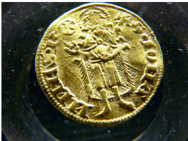
Afb. 1.4 Munt van bisschop Gerlach van Mainz, 1353-1371. Bodemvondst Oudewater, particulier bezit.

Zo heftig als in 1349 werd in de volgende eeuwen niet meer hoewel de stad in de laatste fase van de Hoekse en Kabeljauwse twisten wel de nodige risico's nam. Graaf Willem VI, ook bekend als Willem van Oostervant, gaf Oudewater verschillende privileges. Graaf Willem bevestigde bij zijn aantreden in 1404 de privileges die Oudewater al bezat, gaf de stad een jaar later het windrecht met een nieuw privilege om een eigen molen te mogen bouwen en bevestigde in 1413 het privilege voor het houden van een paardenmarkt. Graaf Willem had geen wettige zoons, alleen een dochter, vrouwe Jacoba. In 1416 ondertekende het stadsbestuur van Oudewater de 'Acte van Belofte' om Jacoba te