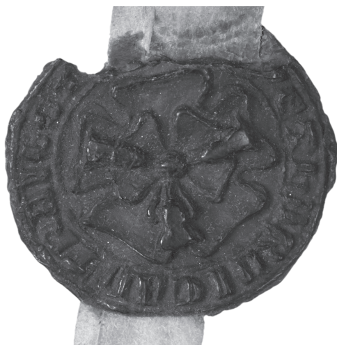
Afb. 1.1 Zegel van Oudewater met viooltje, 1294.

In 1349 daags na Maria Boodschap nam de bisschop van Utrecht, heer Jan van Arkel, met de burgerij van Utrecht de stad Oudewater in. Ze namen vele burgers gevangen, maakten veel buit en zijn roemvol teruggekeerd, nadat tal van eerbare mannen door de Utrechtse burgers waren omgebracht. Men stak de stad Oudewater in brand. Tijdens hun verblijf daar waren Utrechtse raadsleden een huis binnengegaan om zich erover te beraden wat ze met de stad zouden doen. Een vrouw sloot hen daar op en stak het huis in brand, zo zijn ze daar in het vuur omgekomen. 3