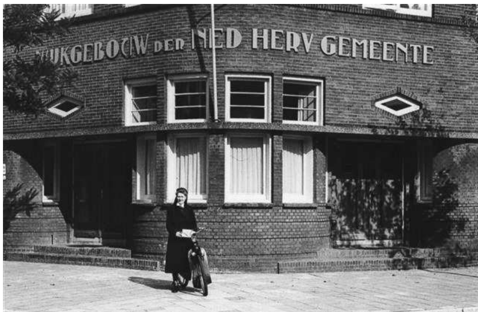
Het wijkgebouw op het Willem van Noortplein