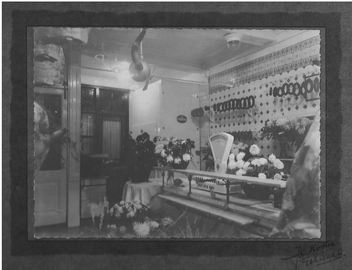
De slagerij van Keizer op Vismarkt 8 in 1934