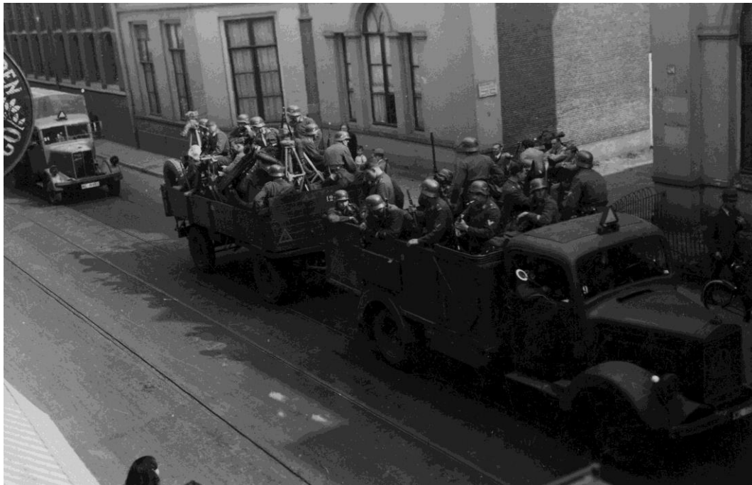
15 mei 1940, Duitse militairen in de Wittevrouwenstraat

Als Leo Vroman op de radio het bericht hoort van de capitulatie, besluit hij te vluchten. Hij neemt afscheid van zijn vriendin en neemt een taxi naar Scheveningen. Daar scheept Leo in op de zeilboot Emma, 'niet voor de zee gebouwd, maar sterk en waterdicht'. Voor de kust van België worden de opvarenden opgepikt door een vrachtboot, die hen naar Engeland brengt.