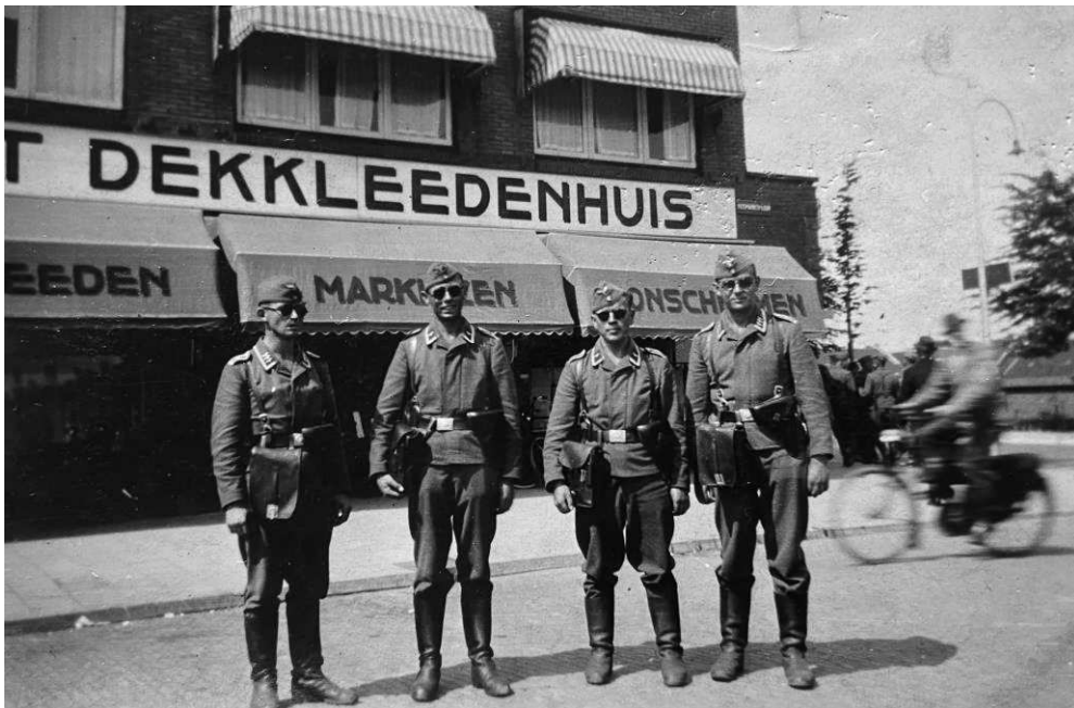
'Für Mammi' staat achterop deze foto met Duitse militairen, Veemarktplein, 29 juni 1940

(...) De kranten zijn totaal ongenietbaar; er staan alleen nog maar mededelingen van het D.N.B. (Deutsches Nachrichtenbüro) in. Nergens staat een letter kritiek op wat dan ook.