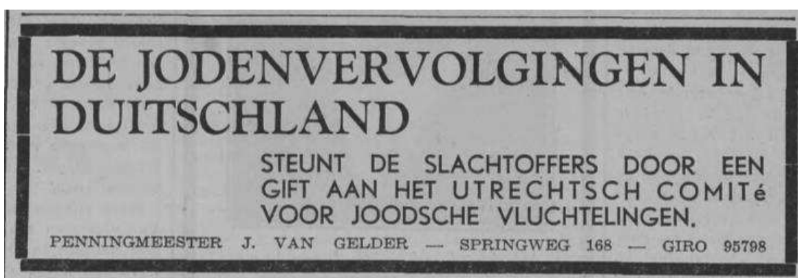
Kort na de Kristallnacht in Duitsland, Utrechts Nieuwsblad, 15 november 1938

In 1935 wordt Duitse joden officieel het staatsburgerschap ontnomen en mogen ze geen seksuele relaties en huwelijken met mensen met 'Duits bloed' meer aangaan. In de nacht van 9 op 10 november 1938 is er in Duitsland een door de nazi's georganiseerde actie tegen het joodse deel van de bevolking. Synagogen worden in brand gestoken, joodse winkels en bedrijven vernield en ook joodse huizen, scholen, begraafplaatsen en ziekenhuizen moeten het ontgelden. Meer dan 30.000 joodse mannen en jongens worden opgepakt en afgevoerd naar kampen in Duitsland. Na deze nacht, die bekend staat als de Kristallnacht - 'de nacht van het gebroken glas' - zoeken nog eens honderdduizenden Duitse joden een goed heenkomen in het buitenland.