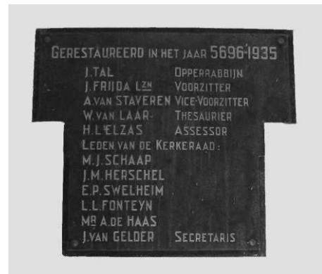
De synagoge aan de Springweg 11 (l) en een plakkaat bij de joodse begraafplaats op het Zandpad