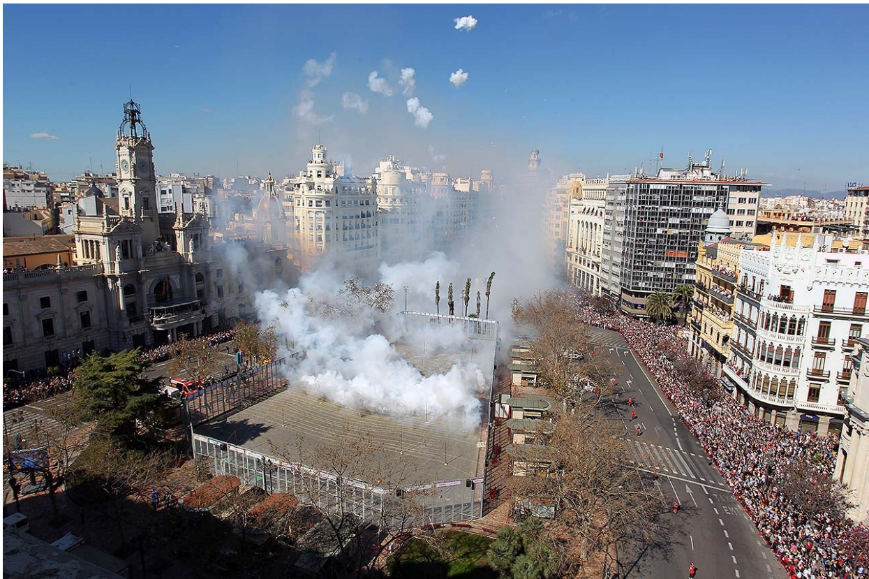
Mascletá in Valencia