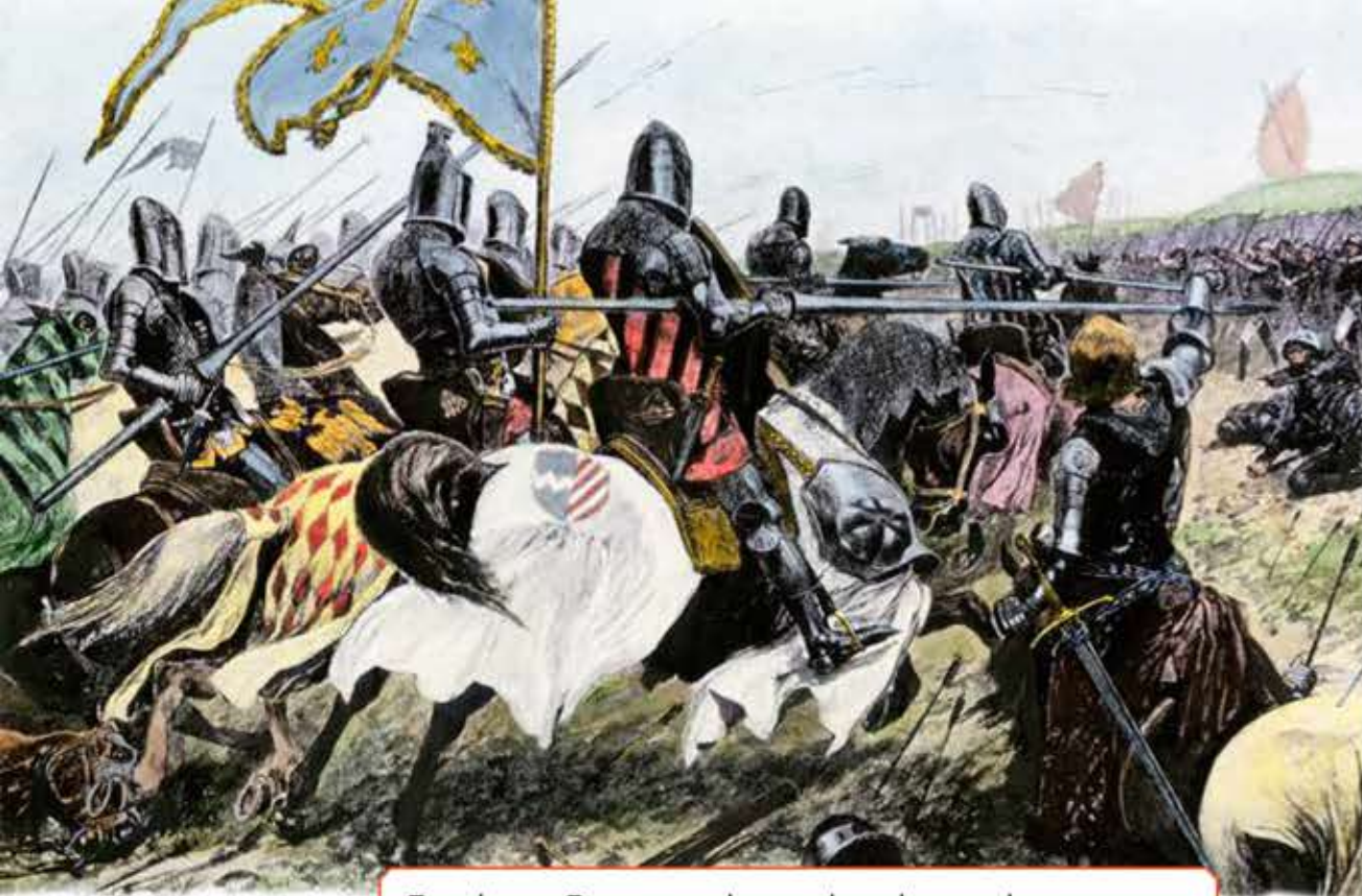
Engelse en Franse strijders vochten langer dan een eeuw tegen elkaar in de Honderdjarige Oorlog (1337-1453).