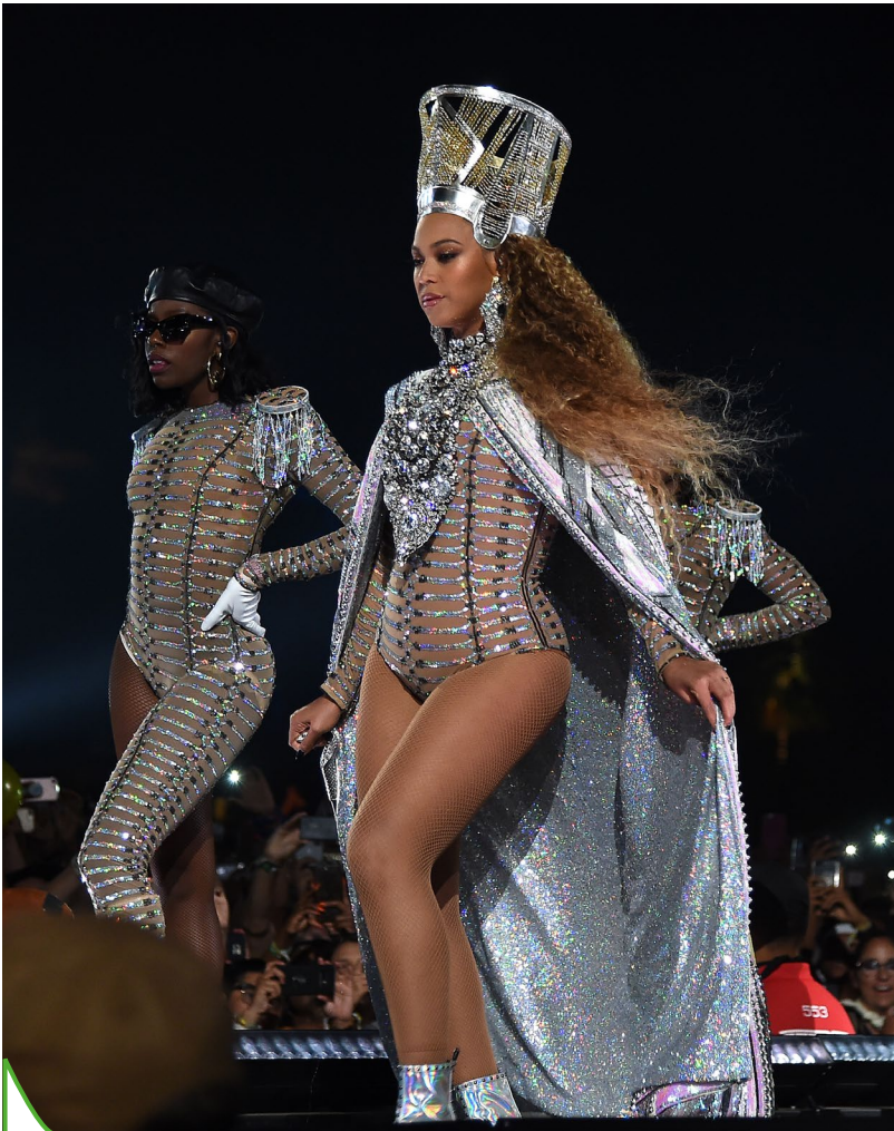
De kroon die zangeres Beyoncé hier draagt, lijkt op de kroon van de Egyptische koningin Nefertiti.

Ze draagt een glimmende, hoge hoed en opvallende sieraden. De Amerikaanse zangeres Beyoncé heeft foto's laten maken waarop ze eruitziet als de Egyptische koningin Nefertiti. Deze koningin leefde meer dan 3300 jaar geleden.