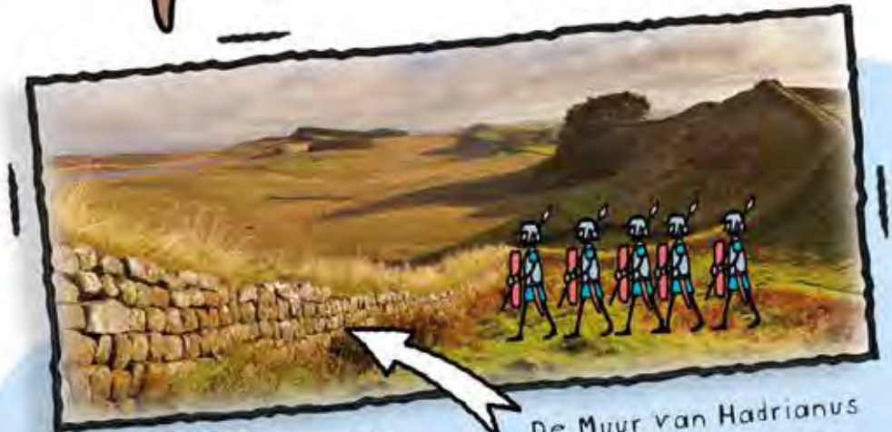
De Muur van Hadrianus werd gebouwd om de noordelijke grens van het Britse rijk te verdedigen.

Soldaten vochten voor een vaste periode. Daarna kregen ze een stuk land om op te leven.