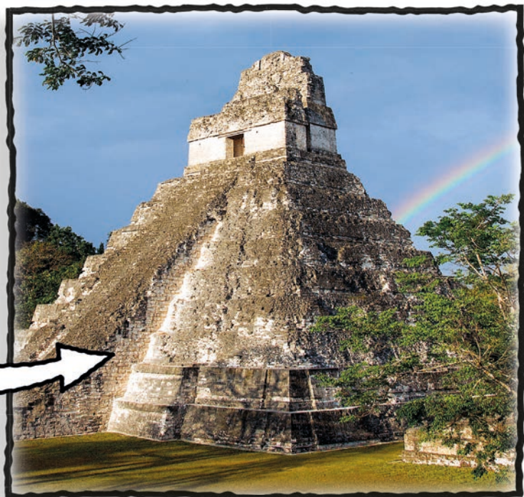
Deze Mayatempel is ontdekt in Tikal, in Guatemala.

De verre voorouders van de Maya's trokken zo'n 14.000 jaar geleden Meso-Amerika in. Zo noemen we het gebied waar nu het zuiden van Mexico, Guatemala, Belize, Honduras en El Salvador liggen.