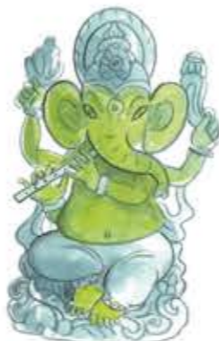
Ganesha wordt vaak afgebeeld met een fluit.

Van oudsher zingen mensen hun goden toe. Hindoes gebruikten delen van de Veda's, oude heilige teksten, om Shiva, Ganesha en andere goden te eren. Ook moslims zingen tijdens het bidden. Een eeuwenoude religieuze muziekstijl afkomstig uit India en het huidige Pakistan is qawwali. Ook binnen het christendom is zingen een belangrijk element. De hemel wordt vaak voorgesteld met engelenkoren. En denk ook aan psalmen, kerstliederen en gospelkoren. In de eerste eeuwen van het christendom zongen koren in kerken serene Gregoriaanse gezangen. In de loop der tijd ontwikkelde zich dit tot cantus planus, waarbij iedereen tegelijkertijd Latijnse teksten zingt op dezelfde melodie.