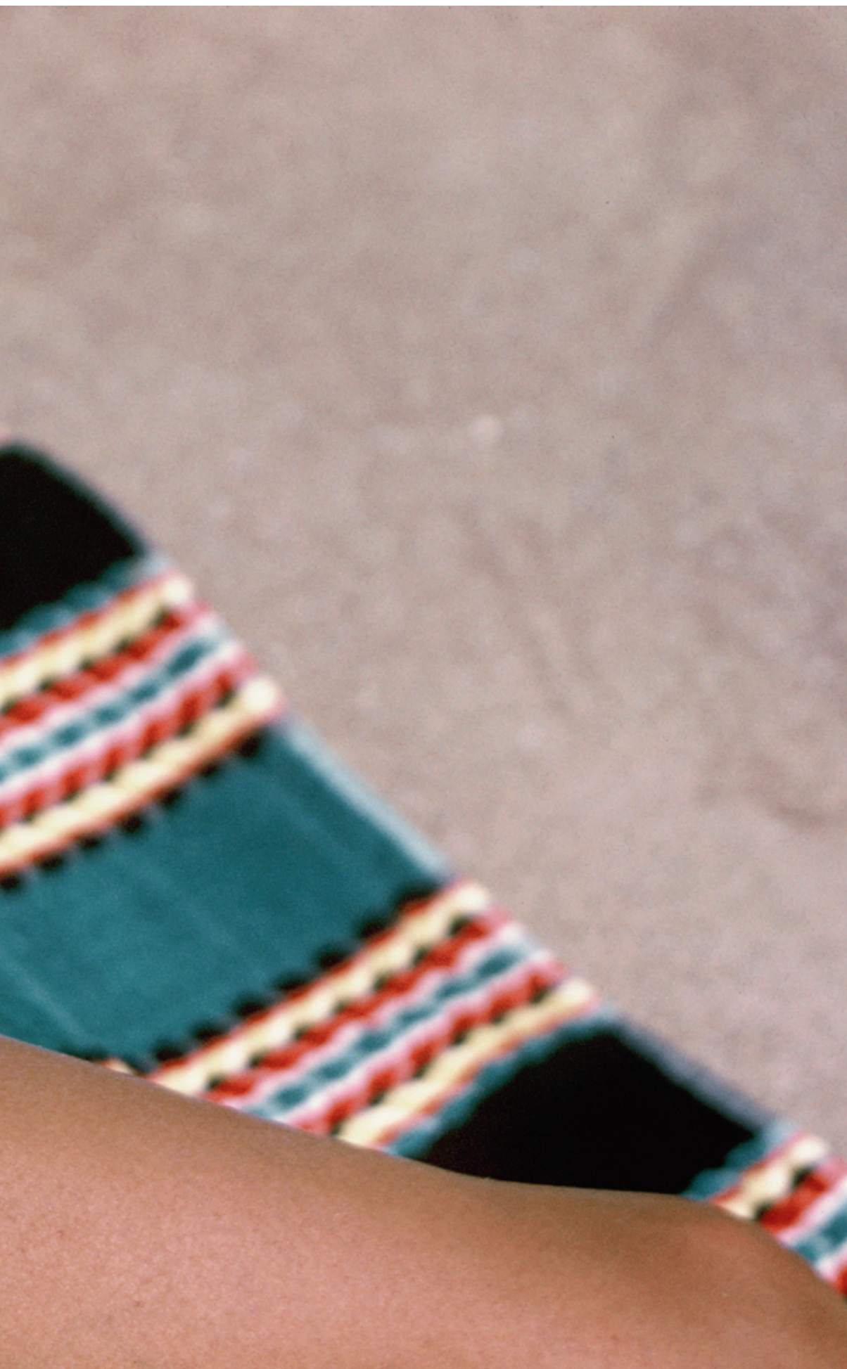
Ibiza, juni 1959