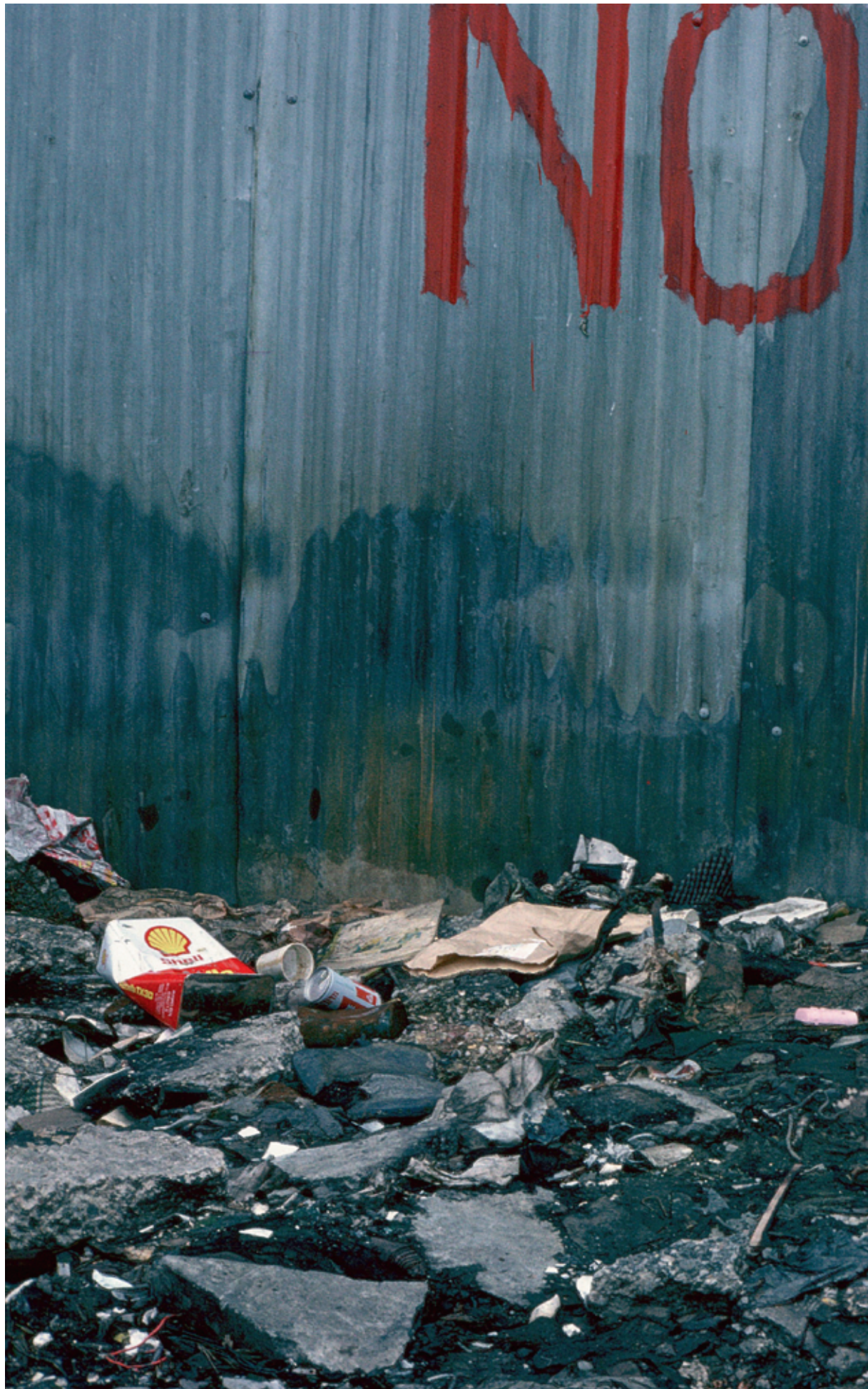
'No Rubbis' [sic], Sclater Street, Londen, 29 april 1979