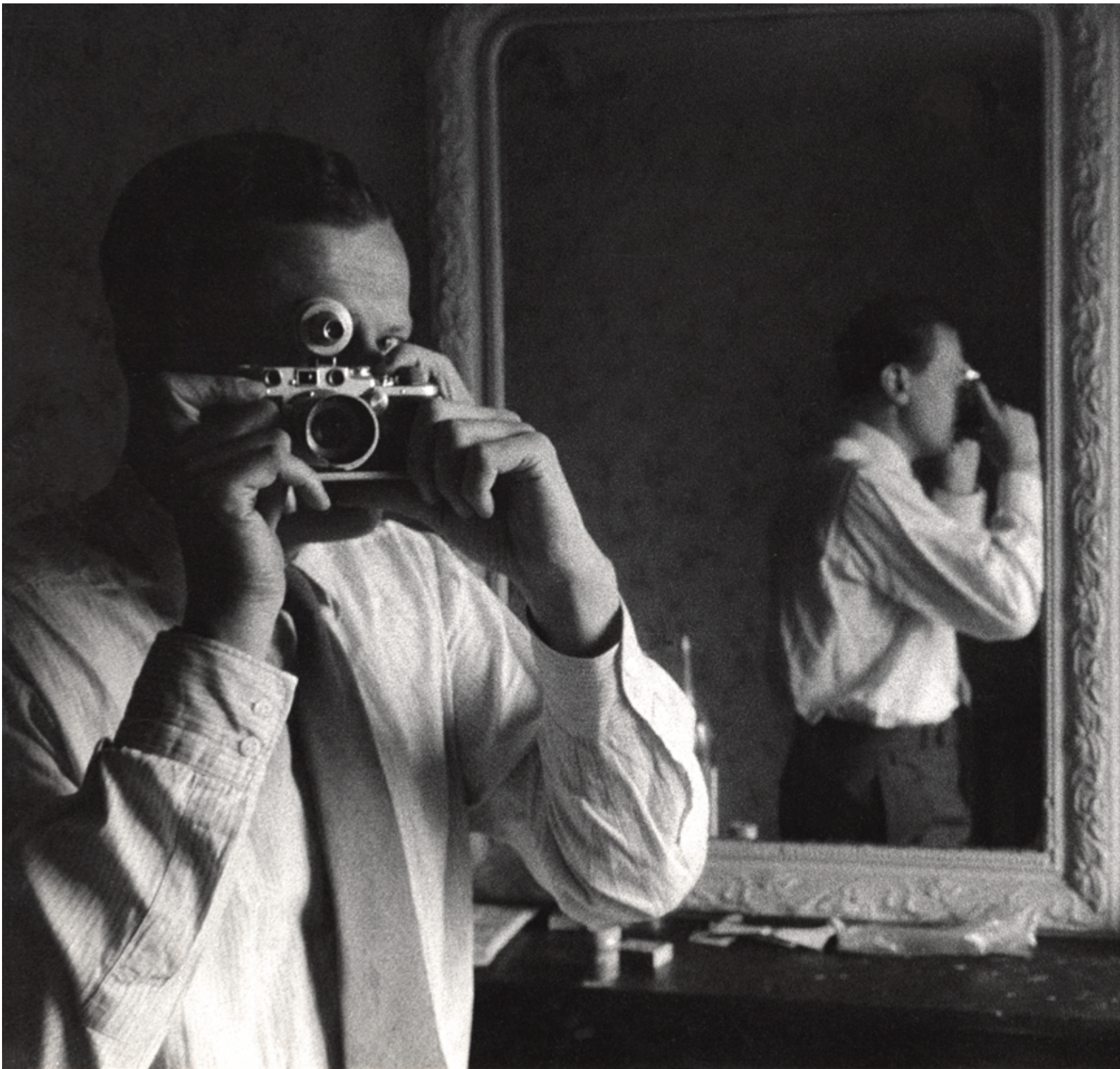
Zelfportret in spiegel Notre Dame-hotel, Parijs, augustus 1957