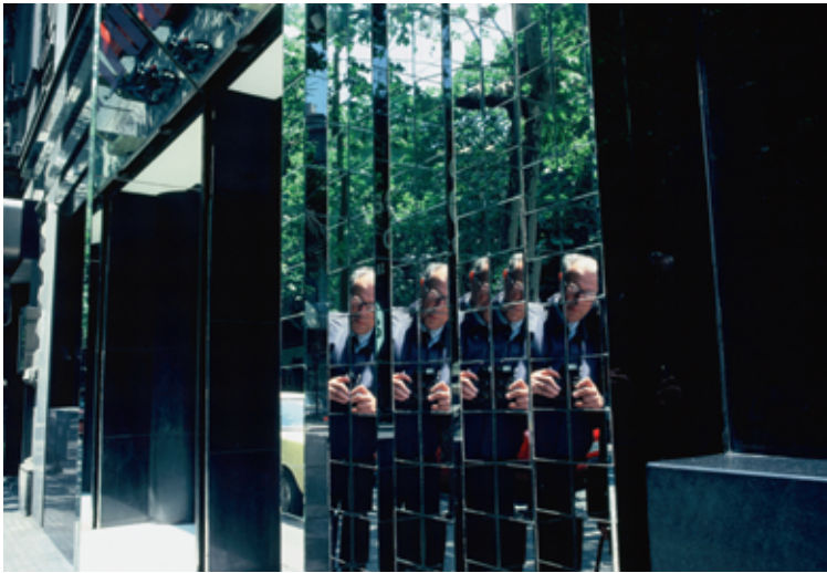
Zelfportret, Barcelona, mei-juni 1982