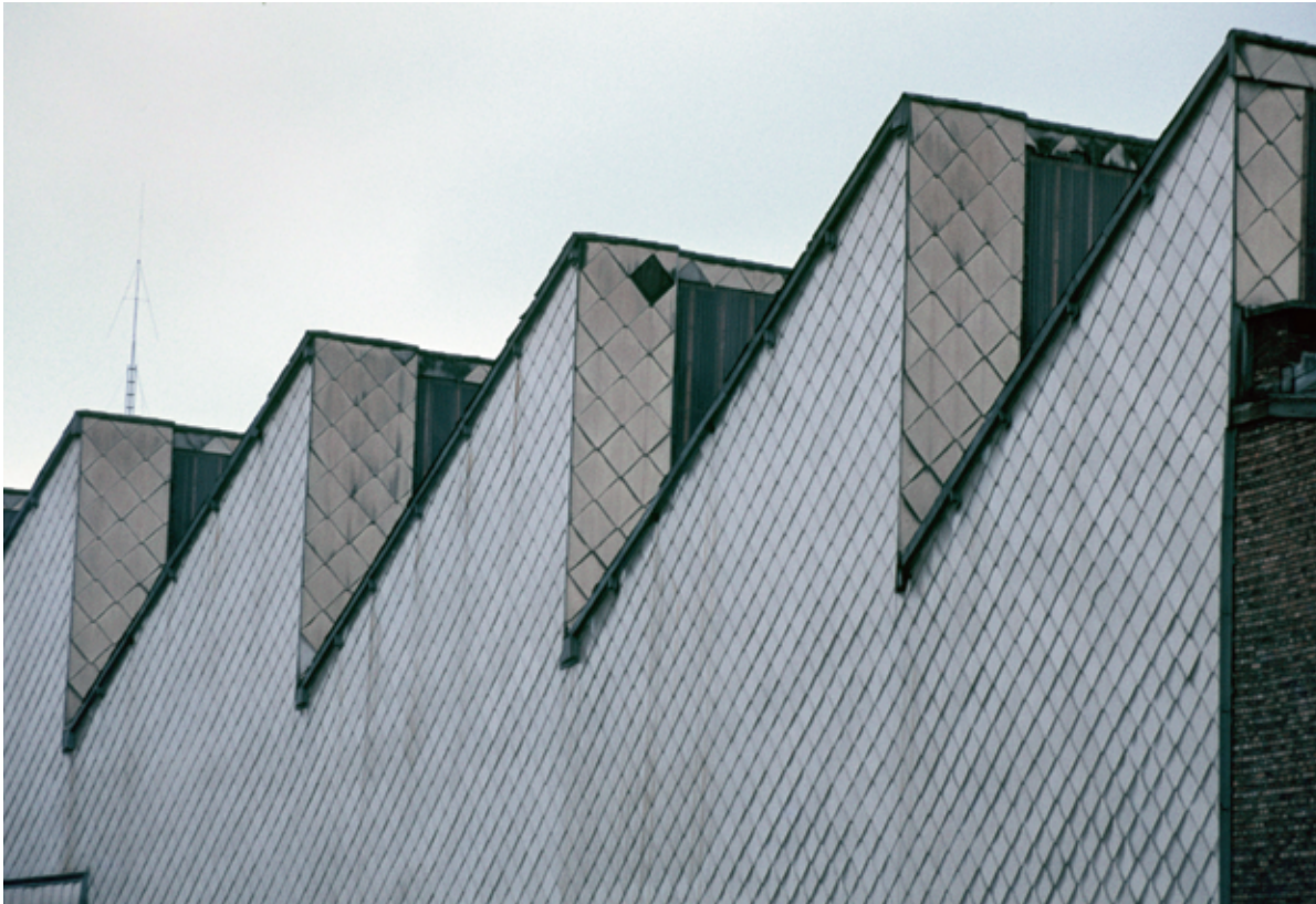
Fabrieksdak, Brussel, 22 mei 1984