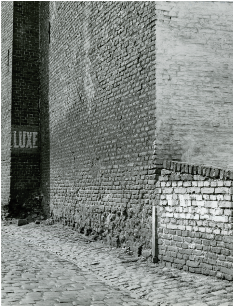
Muur met opschrift LUXE, België, september 1958