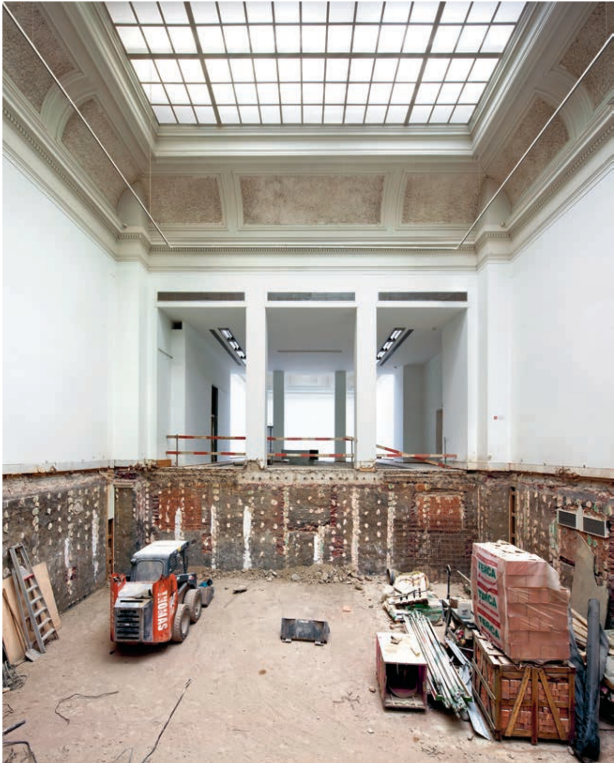
Een van de patio's tijdens de sloopwerken.