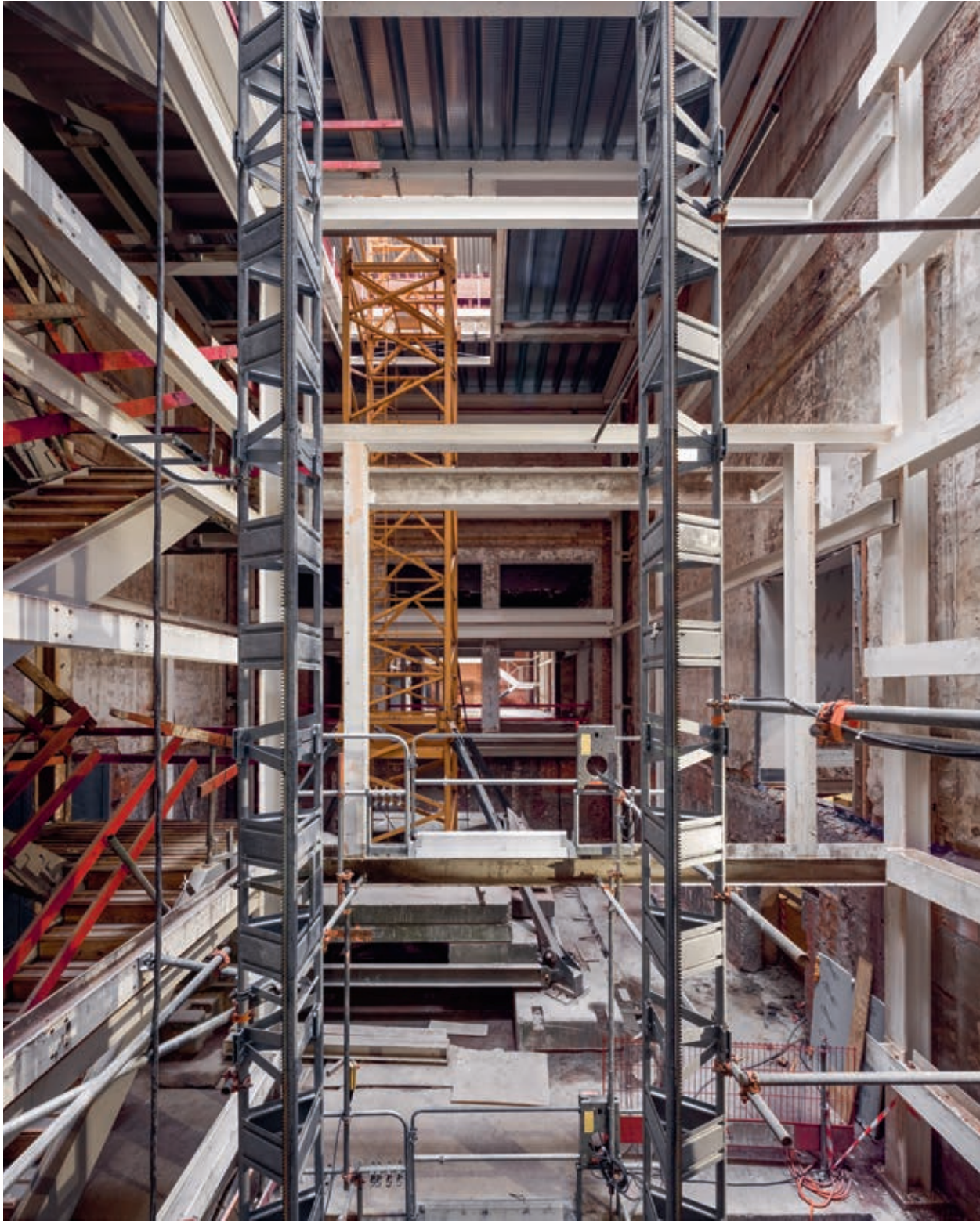
Om het nieuwe museumvolume vorm te geven werd een staalstructuur geplaatst van in totaal 1.000.000 kilogram.