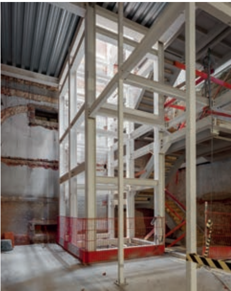
Staalconstructie van een van de vides.