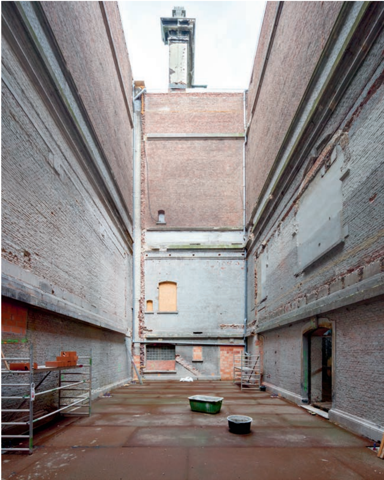
Vrijgemaakte patio's maakten plaats voor het nieuwe verticale museum.