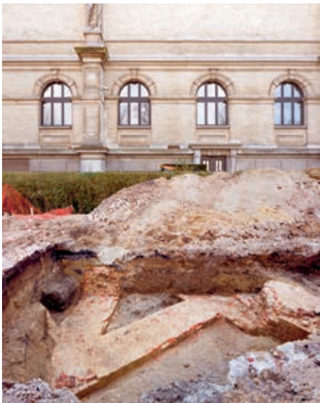
De archeologische resten van de citadel van Alva werden tijdens de verbouwing gedocumenteerd.