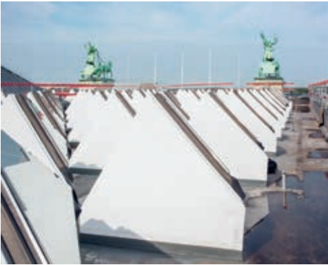
198 witte dakkoepels vangen het daglicht.