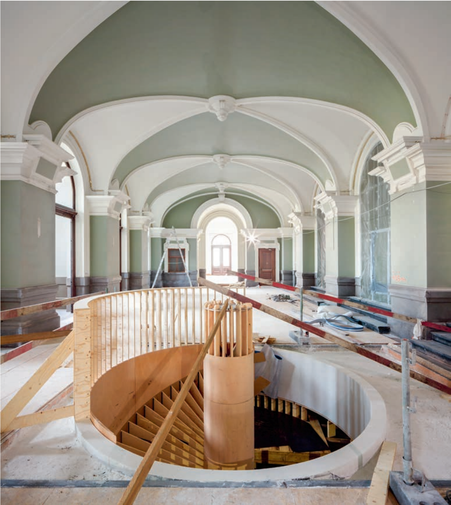
De betonnen wenteltrap in de toegangshal is in één stuk gegoten.