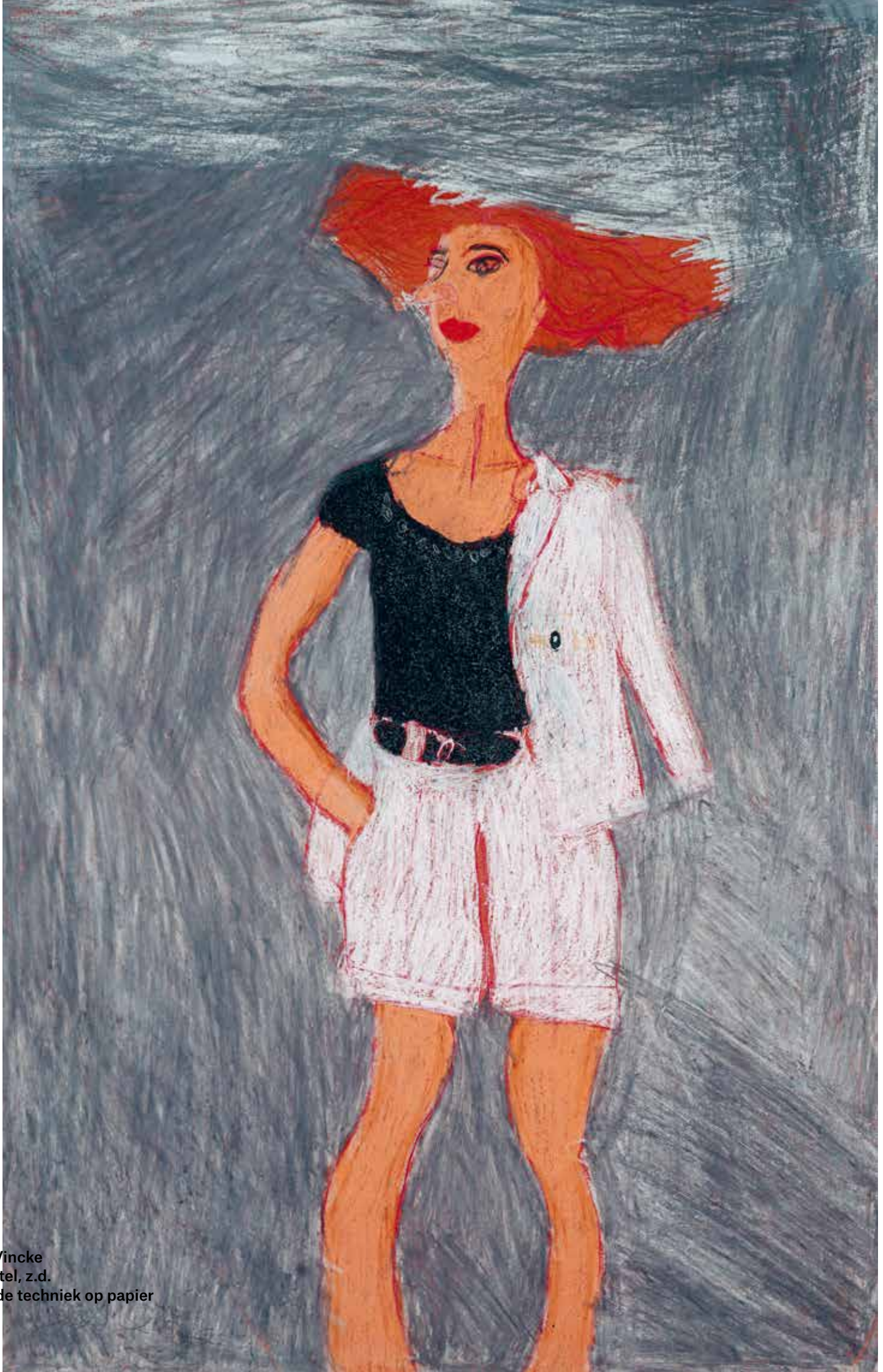
Pascale Vincke Zonder titel, z.d. Gemengde techniek op papier