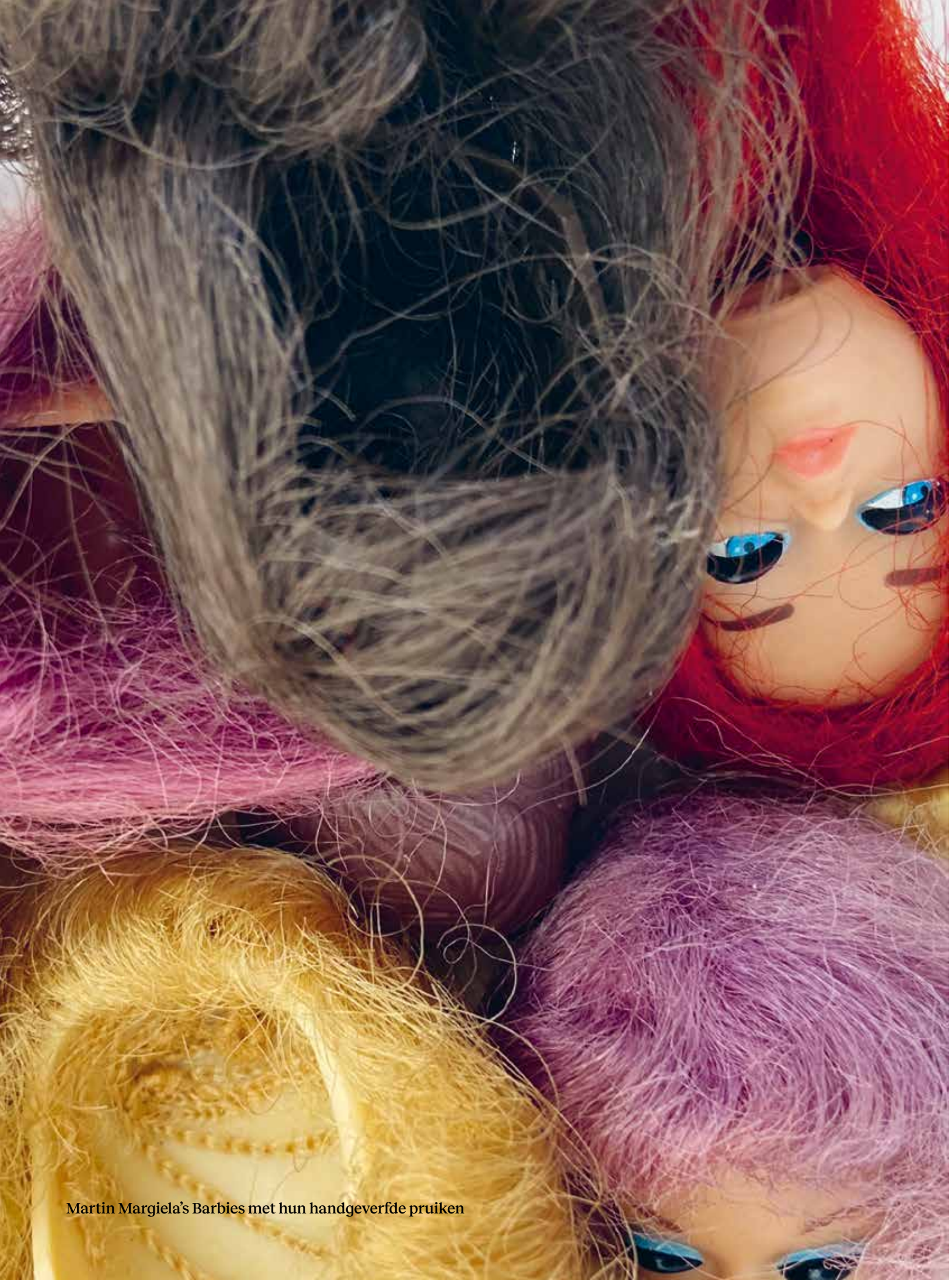
Martin Margiela's Barbies met hun handgeverfde pruiken