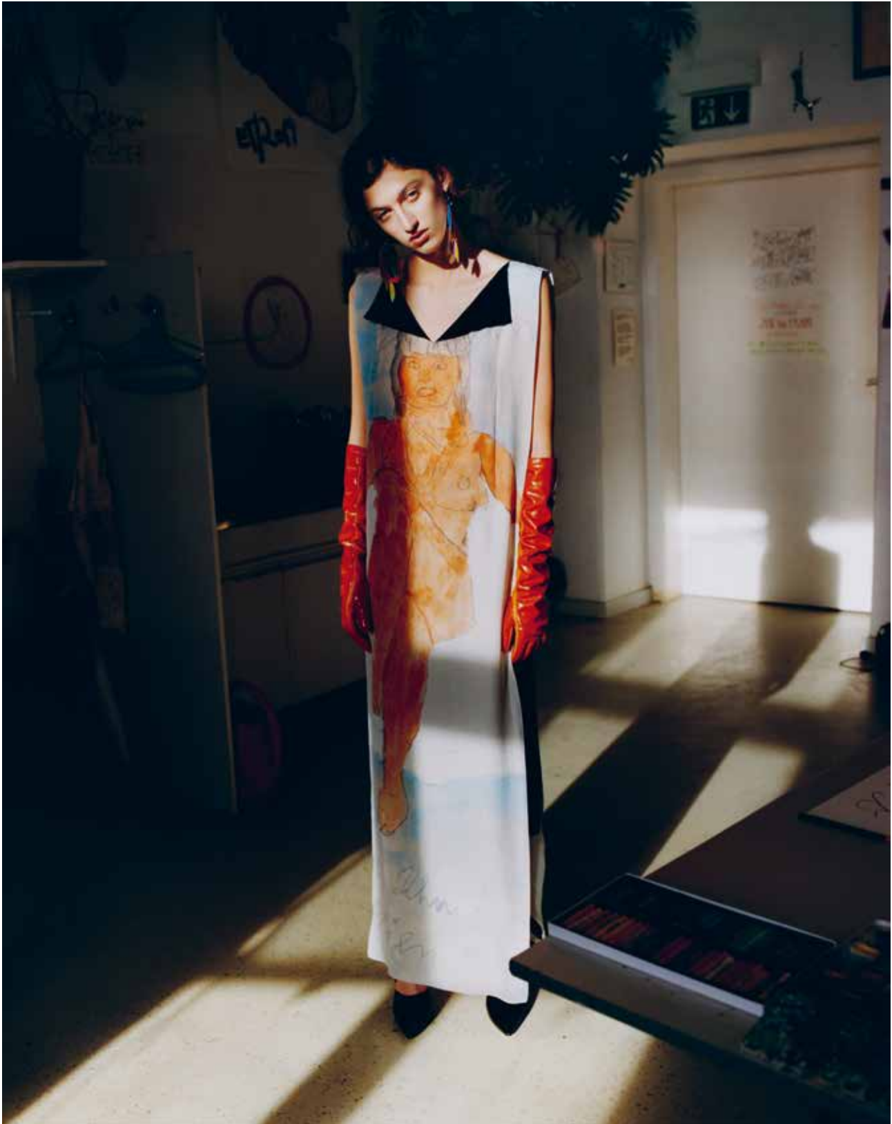
Christopher Kane Pre-Herfst 2017