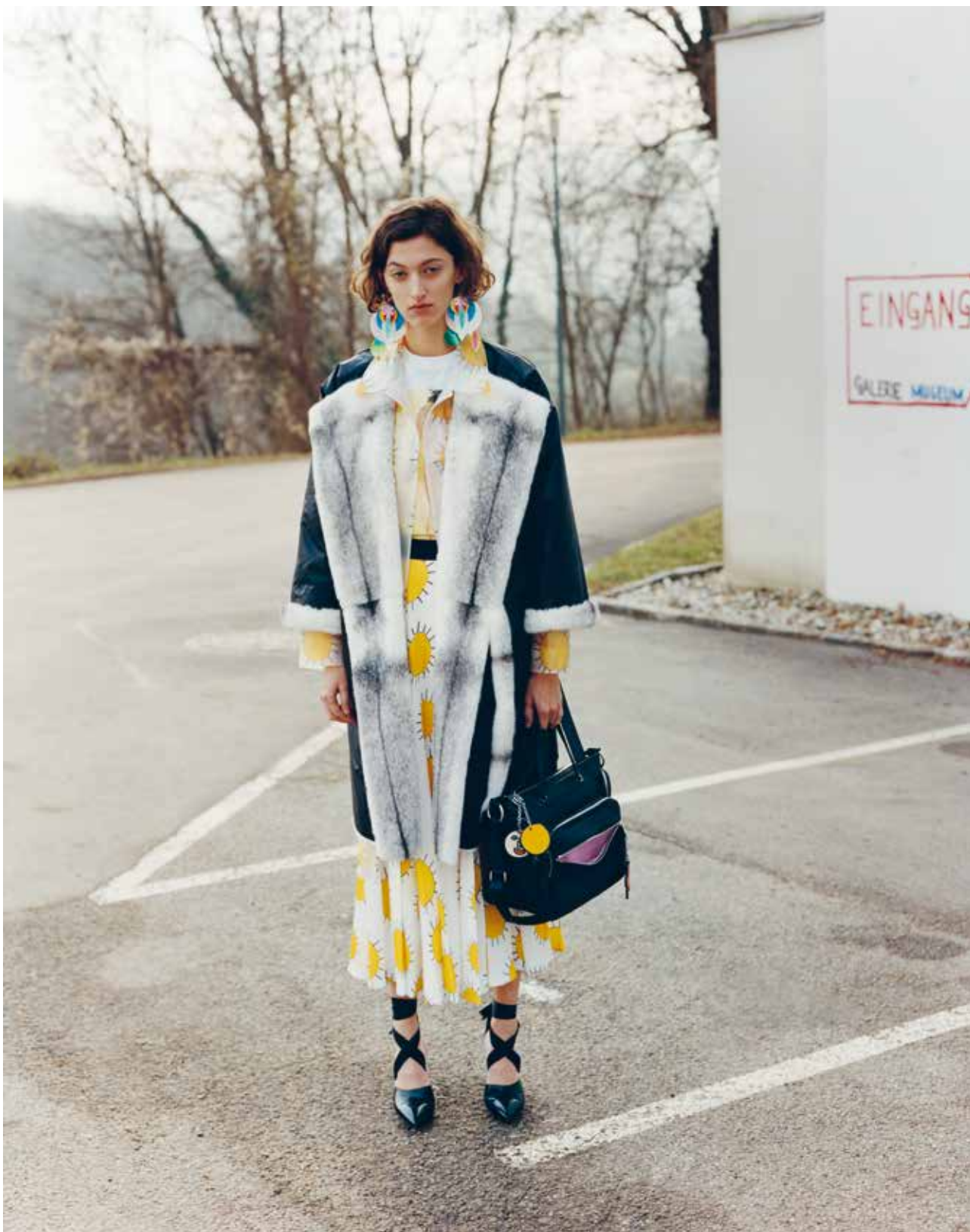
Christopher Kane Pre-Herfst 2017