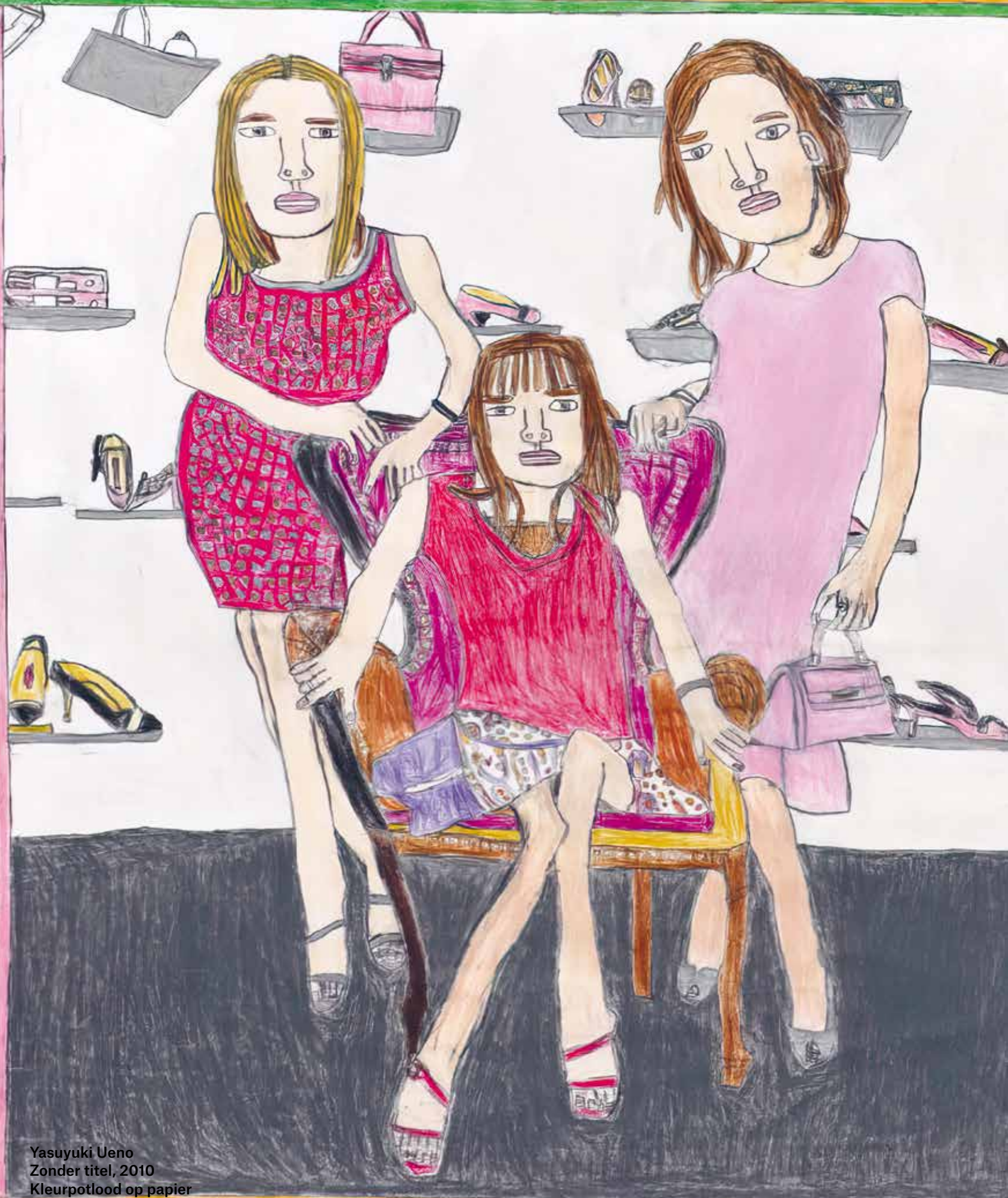
Yasuyuki Ueno Zonder titel, 2010 Kleurpotlood op papier