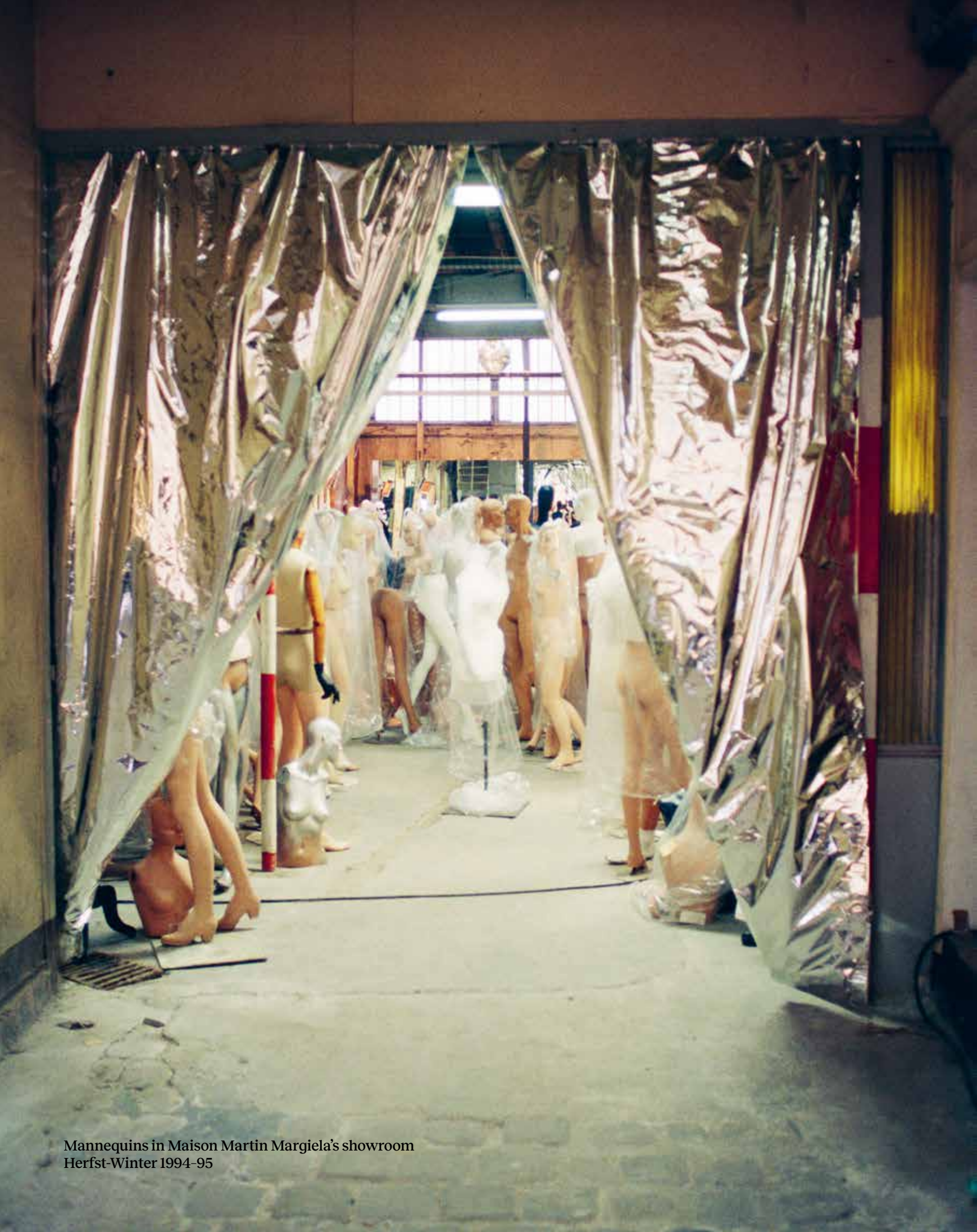
Mannequins in Maison Martin Margiela's showroom Herfst-Winter 1994-95