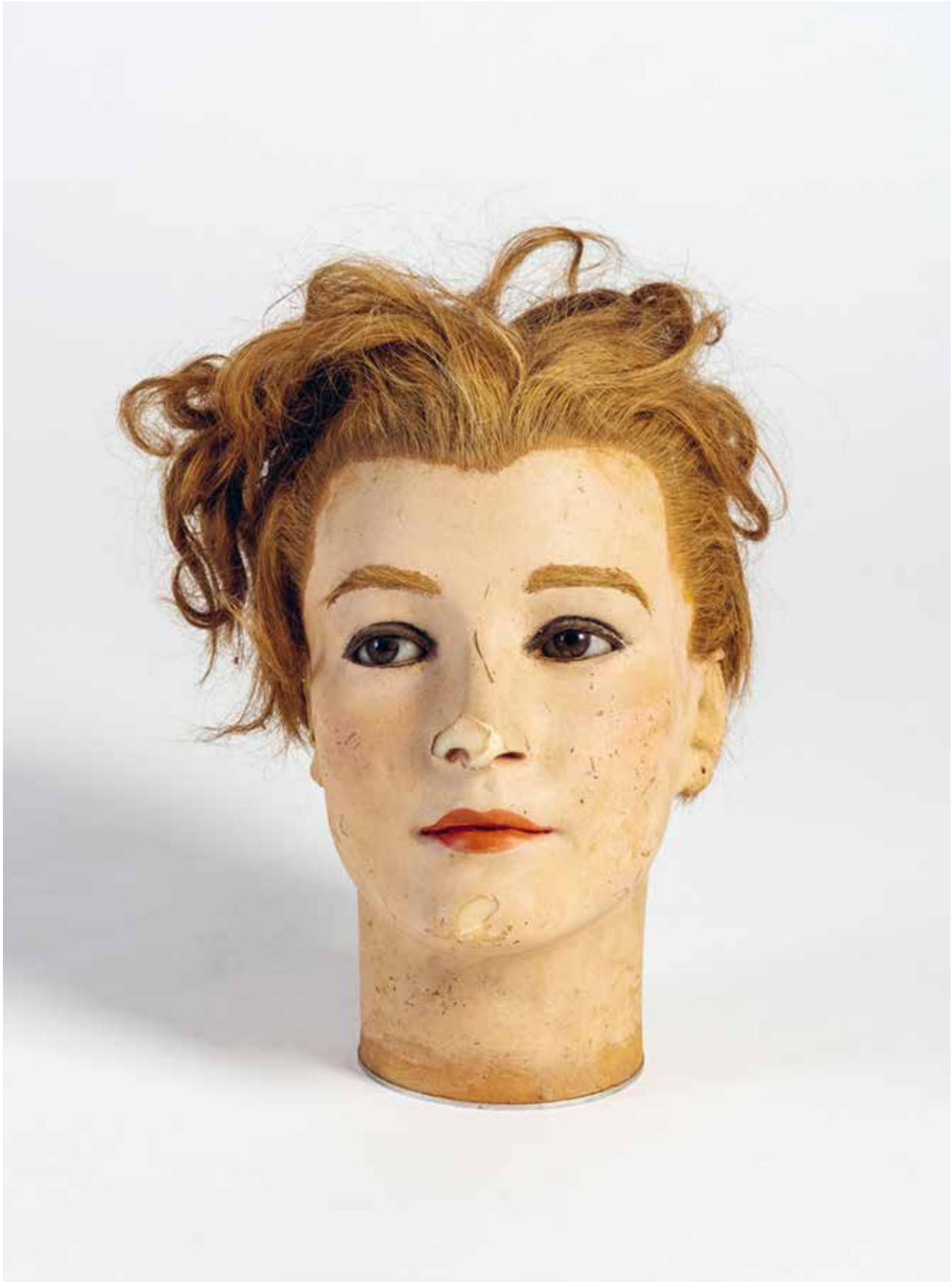
Imans hoofd, jaren 1920