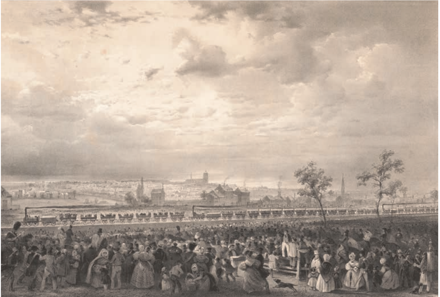
Cat. 5 Théodore Fourmois, Inhuldiging van de Belgische spoorwegen op 5 mei 1835 (zicht genomen nabij Brussel) Lithografie. Brussel, Koninklijke Bibliotheek van België, Prentenkabinet