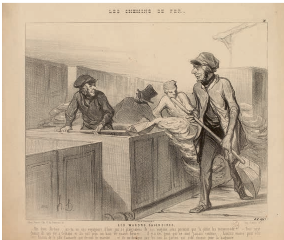
Cat. 29 Honoré Daumier, Badkuipwagons , 1843 Lithografie, 27,5 × 35,9 cm. Parijs, Musée Carnavalet – Histoire de Paris

hoedt men zich in het algemeen voor contacten met medereizigers. Stille wordt op prijs gesteld en reizigers verdiepen zich in hun kranten en lectuur. 60 Er wordt ook niet gerookt. In de derde klas daarentegen gaat het er veel levendiger aan toe, er wordt luidop gepraat, gezongen, gerookt en gegeten. 61 Maar de reiservaringen verschillen ook per land. In Nederland hoopt Hildebrand dat hij in de trein geen last meer zal hebben van rokende, pratende en slapende medereizigers zoals op de diligences. 62 Dickens valt het contrast op tussen de Victoriaanse treinen in Engeland waar stilte heerst en de ruimere Amerikaanse rijtuigen zonder compartimenten waar tot vijftig personen kunnen plaatsnemen en waar iedereen zonder schroom met elkaar praat. 63 Dit hield verband met het Amerikaanse referentiekader voor reizen per spoor, namelijk de salons van de rivierboten waar het de gewoonte was met medereizigers te praten.