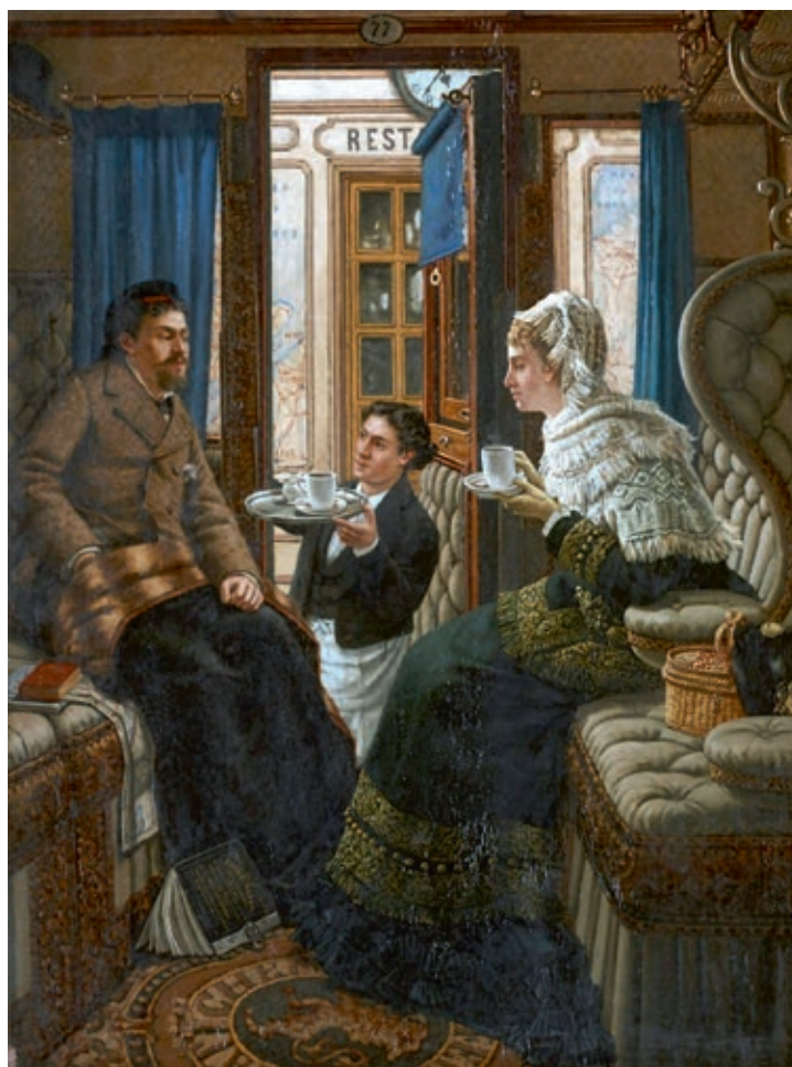
Afb. 8 Constant Cap, De huwelijksreis, 2. De terugkomst , ca. 1865 Olieverf op doek. Utrecht, Spoorwegmuseum

Met het spoor ontstaan ook de eerste mogelijkheden voor uitstappen en toerisme voor minder gegoede klassen. Al in de jaren 1830 wordt de trein in Engeland gepromoot voor excursies naar nabijgelegen steden. Speciale treinen worden ingelegd voor bezoeken aan prijskampen, paardenraces en zelfs executies. Zondagsscholen benutten de trein voor zondagse uitstappen. Al in 1841 duikt in dit kader de naam van een zekere Thomas Cook op die een reis organiseert voor anti-alcohol bijeenkomsten van de Temperance Movement . 70