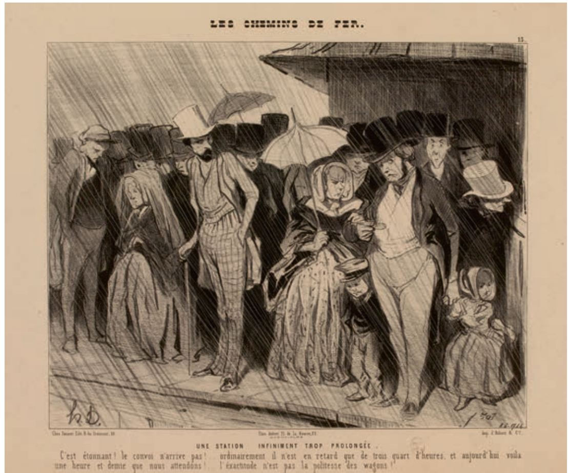
Cat. 30 Honoré Daumier, Een oneindig lange stop , 1843 Lithografie, 27,5 × 35,6 cm. Parijs, Musée Carnavalet - Histoire de Paris

In België worden de open rijtuigen in 1838 van een dak voorzien. Maar de afsluiting aan de zijkanten bestaat slechts uit gordijnen. 54 In Engeland verschijnt in 1844, na een onderzoek naar de ellendige toestanden op de open derdeklasrijtuigen, de Parliamentary Act . Deze verplicht de treinmaatschappijen onder meer om niet sneller dan 20 km per uur te rijden en ook afgesloten derdeklasrijtuigen aan te bieden. Maar niet iedereen is direct van dit laatste op de hoogte. Op de lijn van Bristol naar Bath overlijdt in maart 1845 de arbeider John Jonathan kort na zijn aankomst in Bath en een rit van 16 km als gevolg van extreme onderkoeling. 55 De verbeteringen van de derdeklasrijtuigen zijn onderdeel van de democratisering van het vervoer per spoor. Toenemende welvaart, verbetering van het comfort van de derde klas en lage prijzen leiden ertoe dat het aantal reizigers in derde klas explosief toeneemt. Zij zorgen in de loop van de 19de eeuw voor een steeds