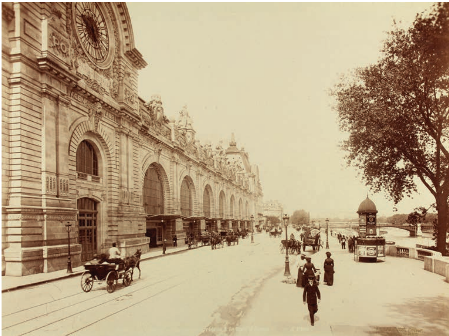
Afb. 7 Gare d'Orsay, Parijs, ca. 1900