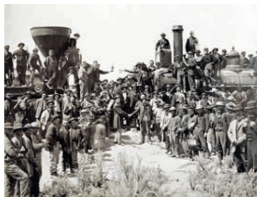
Afb. 4 Aansluiting van de Central Pacific Railroad en de Union Pacific Railroad op de eerste transcontinentale lijn in de Verenigde Staten van Amerika, in Promontory Summit, Utah, op 10 mei 1869.

Afrika is het laatste continent dat de spoorwegen zullen ontsluiten. 15 De Britten leggen er de eerste lijnen aan, in Egypte, met als doel de Middellandse Zee en de Rode Zee met elkaar te verbinden en de reis naar India te vergemakkelijken. 16 De Britten bouwen daarnaast ook lijnen in Zuid-Afrika, Oeganda en Nigeria. De Fransen bouwen lijnen in Noord-Afrika, met name Algerije, en in Senegal. Tussen 1890 en 1898 wordt de eerste spoorverbinding aangelegd in Congo Vrijstaat, tussen Leopoldstad (het huidige Kinshasa) en Matadi. 17 Een belangrijk verschil met Europa en Noord-Amerika is dat de spoorwegen die door koloniale mogendheden worden aangelegd in Azië en Afrika geen netwerk vormen maar veelal bestaan uit geïsoleerde lijnen die het binnenland met zijn bodemschatten verbinden met de kust. Waar sprake is van een netwerk, zoals in India, is dit geïsoleerd van de buitenwereld. 18