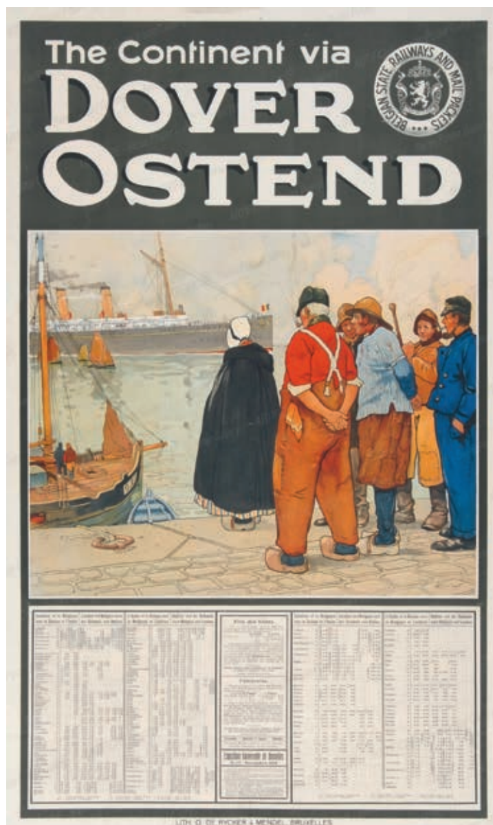
Afb. 5 Hendrik Cassiers, The Continent via Dover-Ostend , Belgian State Railways and Mail Packets... , 1910 Lithografie, 101,8 × 62,5 cm. Privéverzameling

De spoorwegen zelf zorgen ook voor een ongeziene vraag naar ijzer, staal en steenkool en betekenen aldus een stimulans voor de steenkolen- en staalsector alsook voor de metaalnijverheid, de sectoren van de Eerste Industriële Revolutie. Verschillende studies hebben aangetoond dat spoorwegen in de meeste landen een essentiële rol in de economische en sociale ontwikkeling hebben gespeeld. 30 Daar komt nog bij dat het spoor minder afhankelijk is van klimaat en weersomstandigheden dan de scheepvaart. De spoorwegen zijn een zeer betrouwbare, reguliere en veilige transportmodus, met een klein risico van verlies van goederen. 31