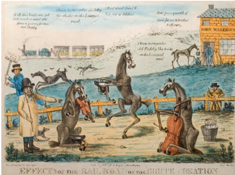
Cat. 13 De effecten van de spoorweg op het dierenrijk, ca. 1833 Gekleurde gravure. Science Museum Group

Plieninger is als wetenschapper zeer geïnteresseerd in de snelheid van de trein die hij schat op 27 tot 33 km per uur. 75 Hij beschrijft de effecten van de snel voorbijvliegende bomen en huizen maar legt zijn lezers uit dat als men zijn blik op een bepaald punt richt, het toch nog mogelijk is planten of zelfs gezichten duidelijk te onderscheiden.