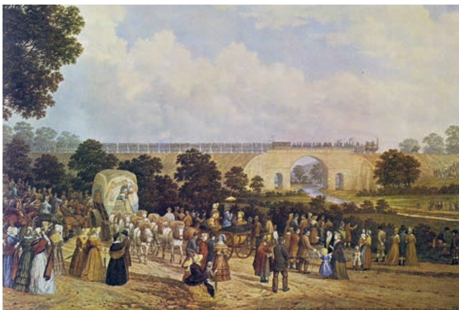
Afb. 1 John Dobbin, Inhuldiging van de eerste openbare spoorlijn, de lijn Stockton-Darlington, in 1825 , ca. 1875 Olieverf op doek. York, National Railway Museum

Jan Antoon Neuhuys, Inhuldiging van de eerste spoorlijn in België op 5 mei 1835 , detail van cat. 4