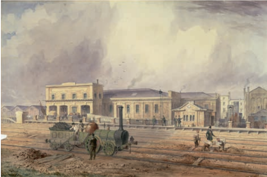
Afb. 6 Anoniem, Het station van Camden Town , ca. 1845 Aquarel, 42,8 × 64,8 cm. Science Museum Group