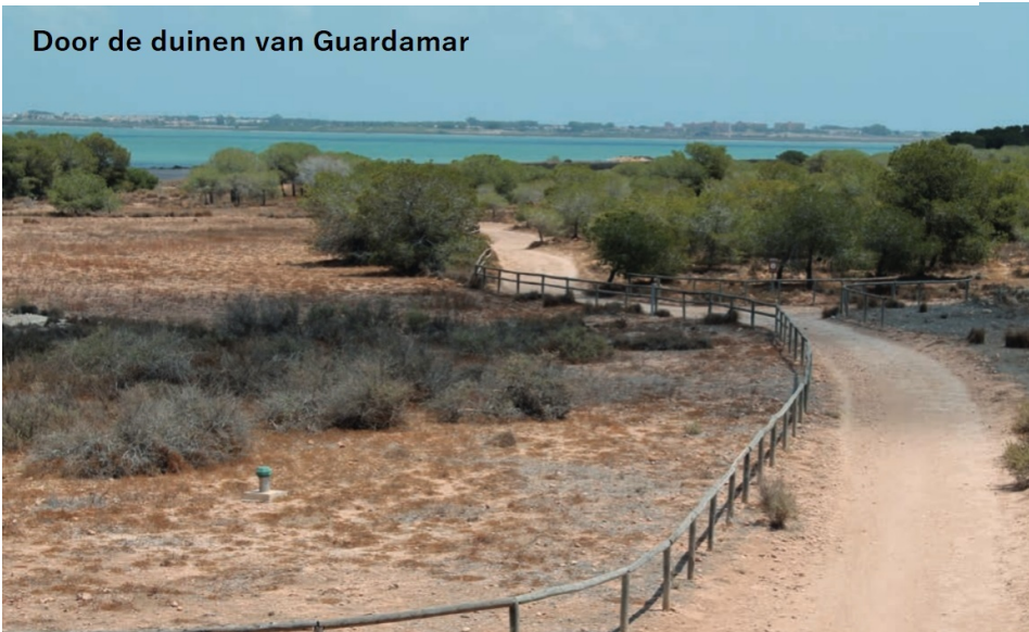
Door de duinen van Guardamar

Het einde van de tocht is het dorp Benijófar.