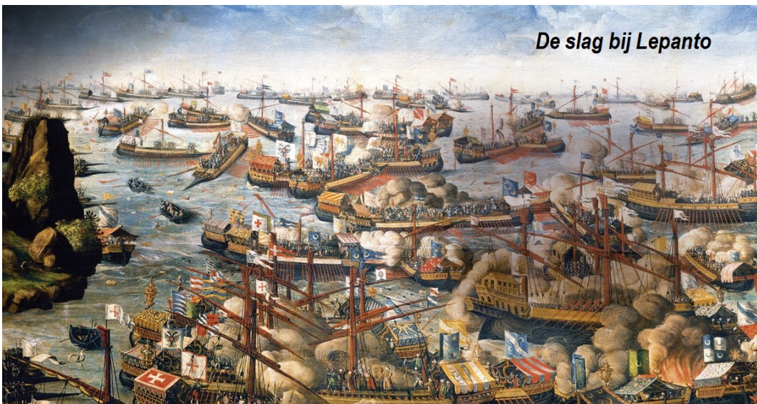
De slag bij Lepanto

Hoewel hij katholiek was, maakte zijn deels joodse afkomst dat hij het niet makkelijk had in het Spanje van de strenge contrareformatie. In 1569 verliet hij Spanje en trad hij in dienst van Giulio Acquaviva, die in 1570 kardinaal werd, en trok naar Italië. Daar publiceerde Cervantes enkele elegieën, maar hij voelde zich meer aangetrokken door het avontuur en lijfde zich in bij het leger.