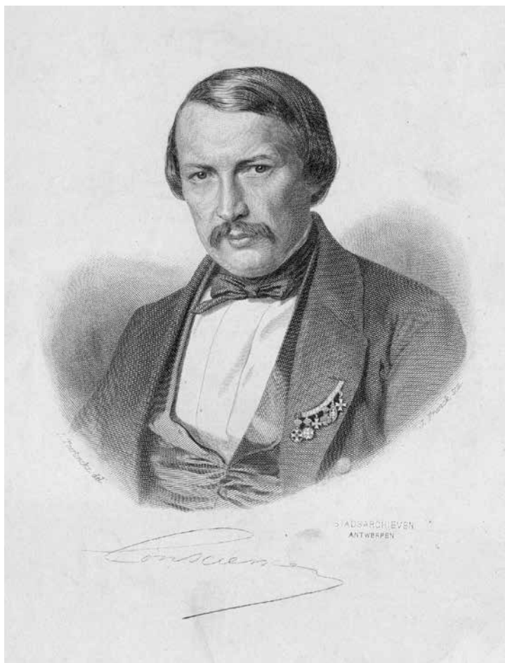
Afbeelding 3: Hendrik Conscience door Louis Tuerlinckx (Felixarchieff Antwerpen). © Wikimedia Commons

dat is het middeleeuws Nederlands – kroniek dateren uit de vijftiende en vroege zestiende eeuw en zijn een bont allegaartje zonder veel samenhang: de een kan niet stoppen met praten over Brugge, de ander vindt de geschiedenis van Gent dan weer het interessantst. Want dat heb je nu eenmaal met een boek in de middeleeuwen: als je graag je eigen exemplaar in je boekenkast had liggen, dan moest je een kroniek (laten) overschrijven. Dit zorgde voor een heleboel