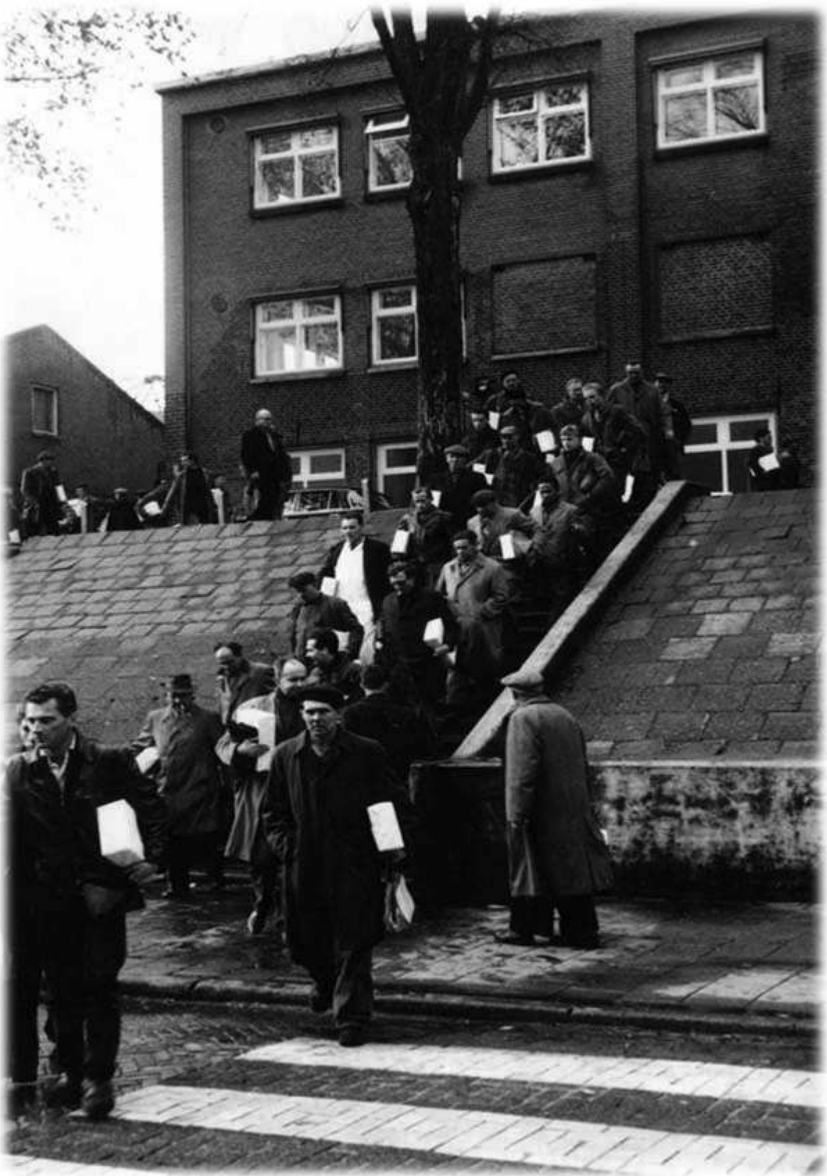
14.011: Als de fluit van Scheepswerf Boele klinkt