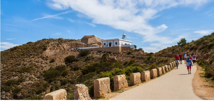
Een uitstekend geasfalteerde weg tot aan de vuurtoren

Heel geleidelijk en haast onmerkbaar gaat het naar boven, zodat we daarna een uitzicht hebben op de bergketens in het binnenland, zoals de Puig Campana, Ponocho, Serella, Xortà en Bernia. Onderweg komen we langs twee aangelegde uitzichtpunten, waar we nog meer van de omgeving kunnen genieten.