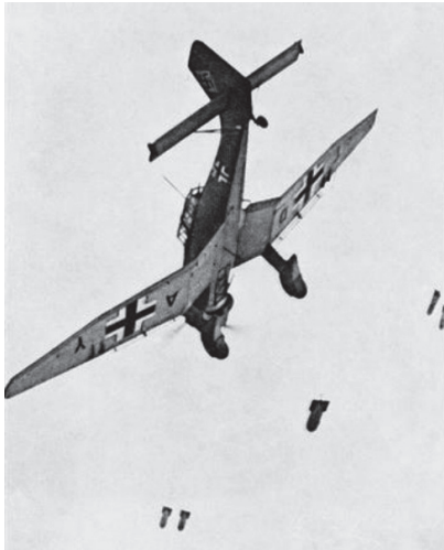
Een Stuka in duikvlucht.

Hoe we het te weten kwamen, weet ik niet meer, maar we moesten blijkbaar in de richting van Normandië. Waar we precies waren, wisten we tegen dan niet meer. We waren echt op de dool. Ont-