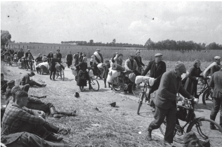
Enkele jonge vluchtelingen rusten uit langs de weg.

Omdat er de volgende ochtend nog altijd geen informatie was en geen trein leek te vertrekken, zetten we onze tocht maar te voet verder, niet wetend waar naartoe. Maar al het volk haastte zich richting Frankrijk, dus wij begaven ons tussen die vluchtelingen met volgeladen stootkarren en kinderwagens. Het was een bijzonder akelig gezicht. Iedereen was bang voor de Duitsers. We liepen tot in Eeklo, waardoor we net als de vorige dag zo'n 65 kilometer aflegden. Eindelijk werden we officieel ontvangen. We waren daar niet alleen: vele jonge streekgenoten van ons waren tot daar gekomen. Het was al laat in de avond toen het gemeentebestuur ons bij burgers plaatste. Mijn broer en ik konden logeren bij twee juffrouwen van rond de vijftig die een hoedenwinkel uitbaatten. We bleven daar twee dagen en in de ochtend van 15 mei kregen we het volgende te horen: zo snel mogelijk naar Frankrijk! Meer informatie kregen we niet. Van enige organisatie was er geen sprake. We moesten maar op eigen houtje daar geraken.