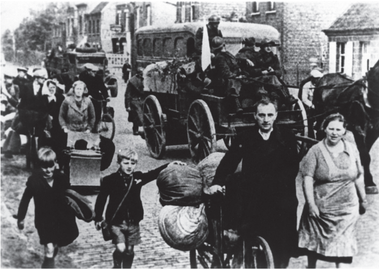
Belgische vluchtelingen in mei 1940.