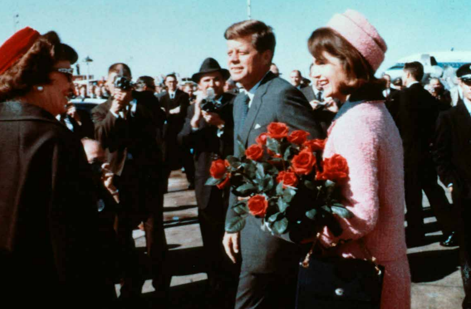
La first lady américaine Jackie Kennedy dans son légendaire tailleur Chanel rose avec le président, quelques heures avant le décès de celui-ci.

Entre-temps, nous apprenons que le tailleur historique n'est pas une création authentique de Chanel. C'est une copie exacte d'un modèle Chanel de la collection d'hiver 1961, réalisée par la maison « Chez Ninon », avec l'accord de Chanel. Le tissu et les boutons ont été fournis par Chanel. Cette formule donnait aux dames américaines la possibilité d'acheter des vêtements issus de leur propre pays tout en bénéficiant de la coupe et des tissus français.