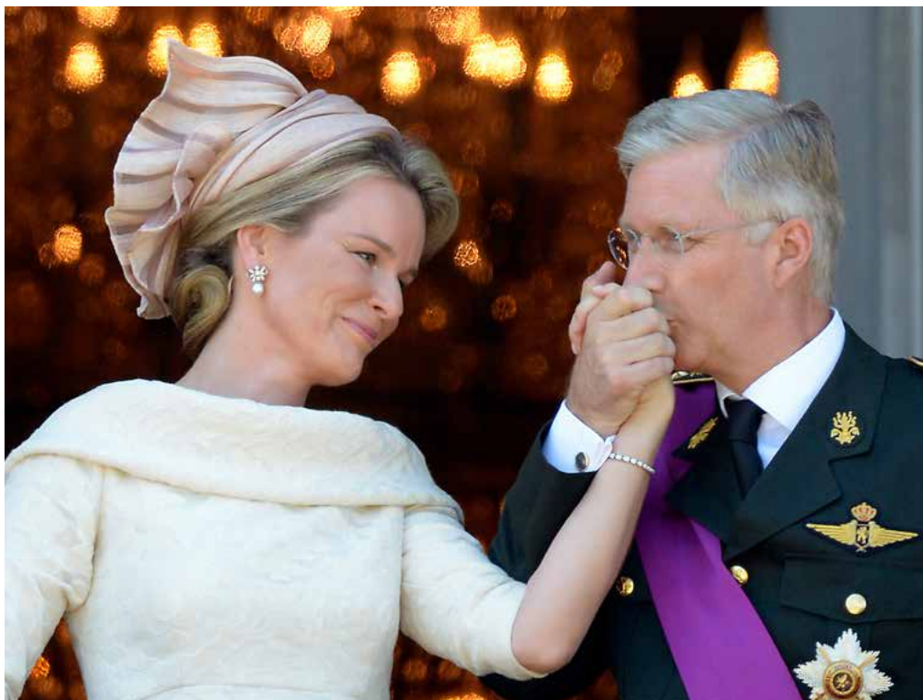
Constitutionnellement, le roi Philippe est le chef de l'état, mais l'éclat d'un pays réside dans sa reine ou first lady. Philippe et Mathilde, le septième couple royal de Belgique. 21 juillet 2013.

Par rapport aux célébrités qui, par elles-mêmes ou grâce à leur partenaire, ont atteint le sommet, il n'y a qu'une poignée de princes et de princesses. Et leurs vies continuent à nous fasciner. Non seulement leurs bijoux précieux et leurs demeures fabuleuses font rêver, mais aussi le fait qu'ils sont invités à dîner en compagnie de hautes personnalités, dans des palais où le code de l'habillement comprend essentiellement robes de gala et diadèmes. Nous sommes secrètement jaloux de la princesse