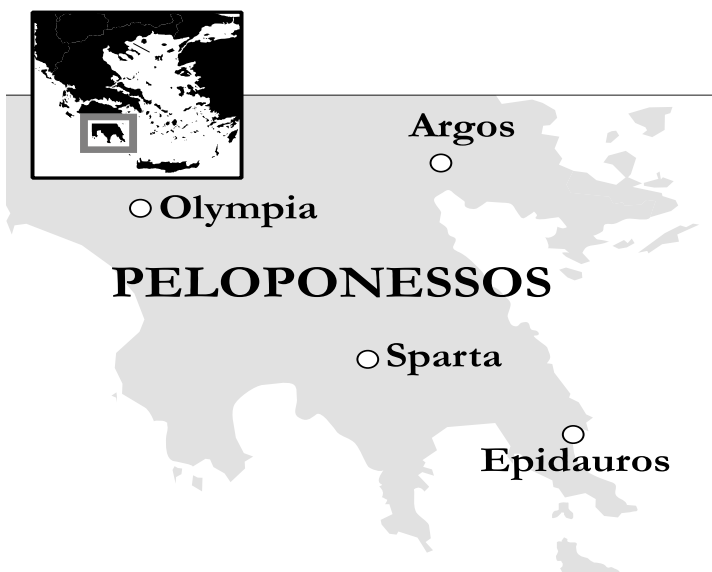
De aanval op de stad Argos werd Pyrrhus fataal.

Volgens Plutarchus verraadde de grote troepenmacht dat Pyrrhus meer wou dan hulp bieden. Hij had de verovering van heel het schiereiland voor ogen, maar moest afdruipe bij Sparta door hevig verzet. Voor Argos kreeg hij hulp van een groepje bondgenoten die op een nacht een stadspoort openden.