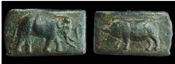
Een aes signatum met de afbeeldingen van een olifant en een varken, bewaard in het British Museum in Londen.

Pyrrhus' olifanten staan ook op een muntstuk van Tarentum en een aes signatum , een primitieve rechthoekige bronzen munt met beeltenis aan weerszijden, onder meer van een olifant en aan de andere kant een varken, vermoedelijk een verwijzing naar de slag bij Asculum (279 v.C.) waarbij de Romeinen met succes brandende en gillende varkens inzetten tegen Pyrrhus' dikhuiden, die in paniek sloegen.