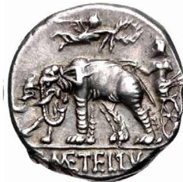
Zilveren denarius van Caecilius Metellus Caprarius, 125 v.C.