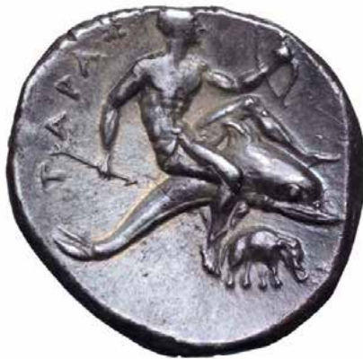
De Tarentijnen herdachten Pyrrhus' olifanten op hun munten, zoals op deze stater: een man gewapend met pijl en boog berijdt een dolfijn, daaronder een olifant. Links het woord Taras, de Griekse naam van de stad.

Na de veldslag stuurde Rome Caius Fabricius, een gewaardeerde maar arme officier, naar Pyrrhus om te onderhandelen over de krijgsgevangenen. Pyrrhus probeerde de gezant om te kopen met goud 'als teken van vriendschap' maar de Romein weigerde. Toen hij de volgende dag opnieuw kwam onderhandelen had Pyrrhus iets anders bedacht. Hij had zijn grootste olifant (mogelijk ging het om Nikon) laten verbergen achter een doek, dat hij op een onverwacht moment liet weghalen. De reusachtige olifant sloeg zijn slurf uit naar Caius Fabricius en trompetterde schrikwekkend. De Romein keerde zich kalm om en zei met een lach: 'Uw goud maakte gisteren geen indruk op mij, en uw beest vandaag ook niet.'