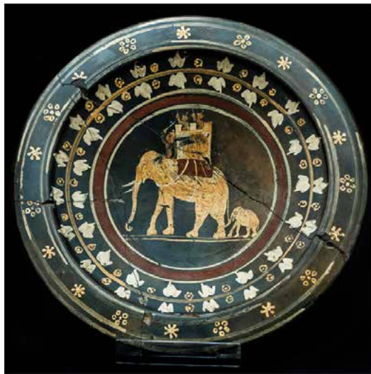
Het Capena-bord: Aziatische olifant met haar kalf.

Daarnaast bestaat er een gelijkaardig bord in 1962 gevonden bij het Corsicaanse Aleria, destijds de grootste Romeinse stad op het eiland; het bord is te bewonderen in het plaatselijke museum.