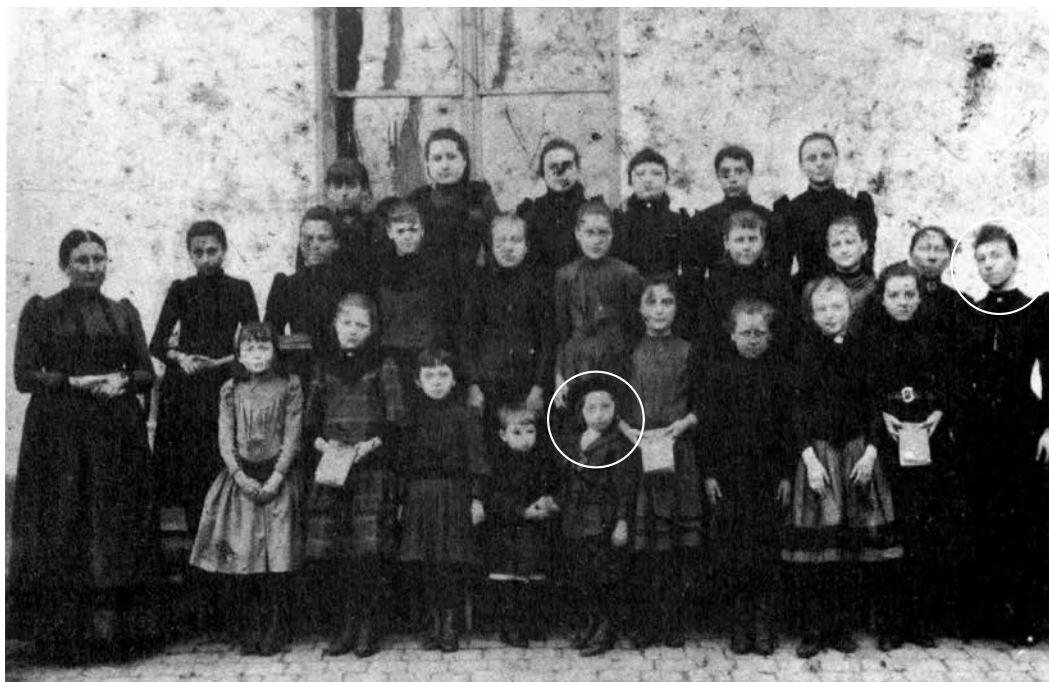
De leerlingen (waaronder RDK) en de leraressen van de Olmstraat (waaronder zijn moeder) [GAUBLOMME & TAVERNIER, 1989 P.10]

mère prétend que vous avez un très grand nez? Evidemment, la mère de Jean Ray n'avait jamais dit telle chose.