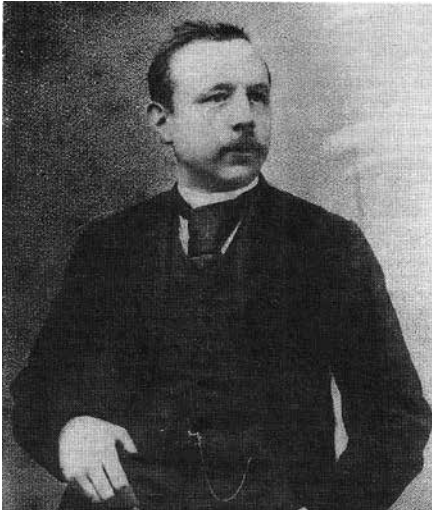
Edward Anseele

Daar is hij weêr, ons aller Vriend, Zoolang aan 't volk ontrukkt, De strenge straf zoo onverdiend, Heeft hem niet neêrgedrukt. Al schonk men hem geen kwijtvergun, Maar banden meer en meer, Daar is onz' dapp're volkstribun Onz' koene strijder weêr. Zes maanden lang heeft hij gezucht, In 't akelige graf, Omdat hij, voor de ramp beducht, Een heil'ge raad ons gaf; Het eeuwig Christelijk gebod, In zijn beroemde brief: "Bemint uw broêrs, sla niemand dood, En hebt elkand'ren lief!"