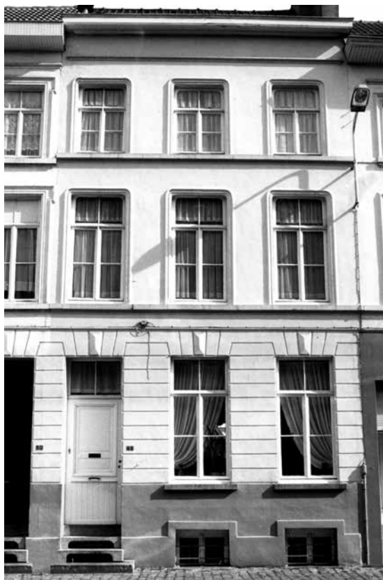
Het geboortehuis van RDK in de Gentse Ham