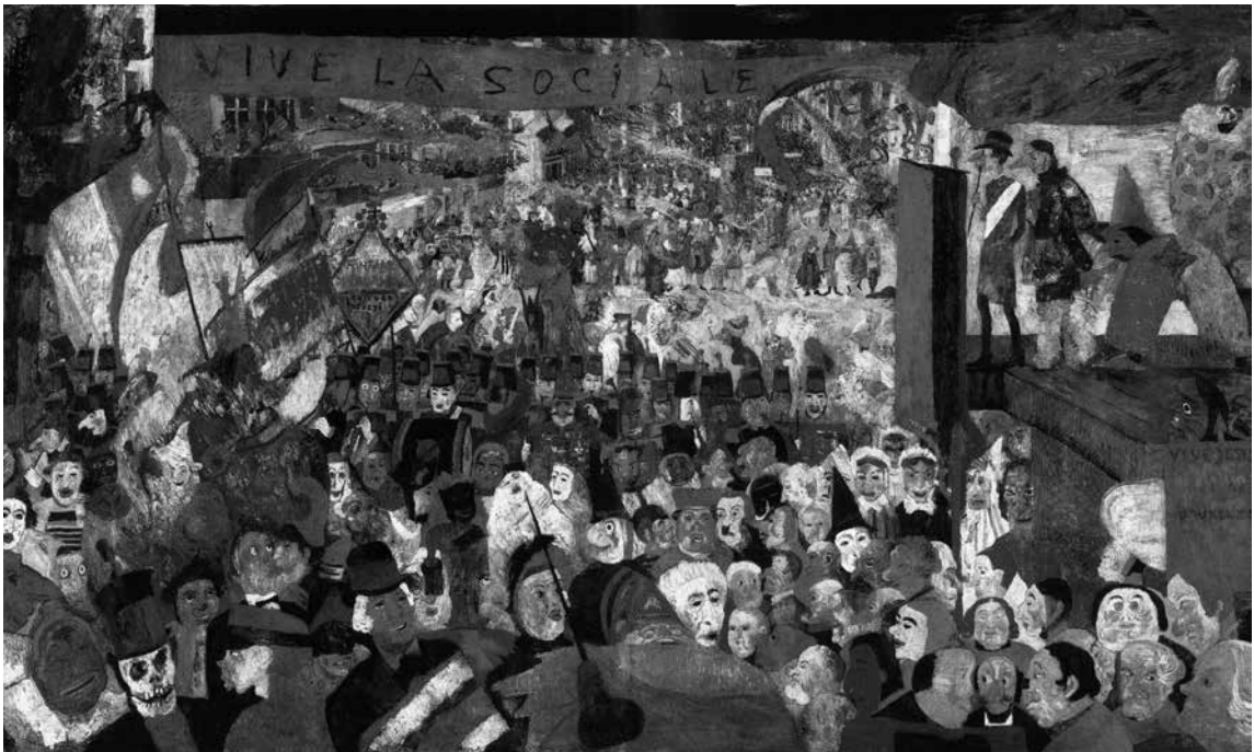
James Ensor, 'De Intrede van Christus in Brussel in 1889'