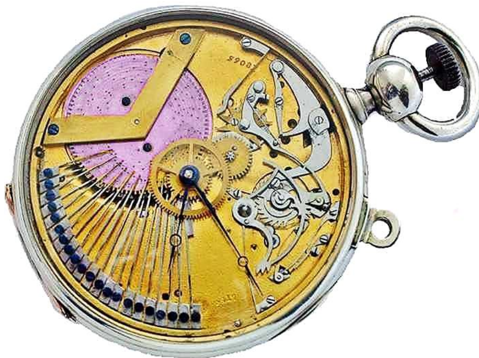
ZAKHORLOGE MET INGEBOUWDE POLYGOONSCHIJF