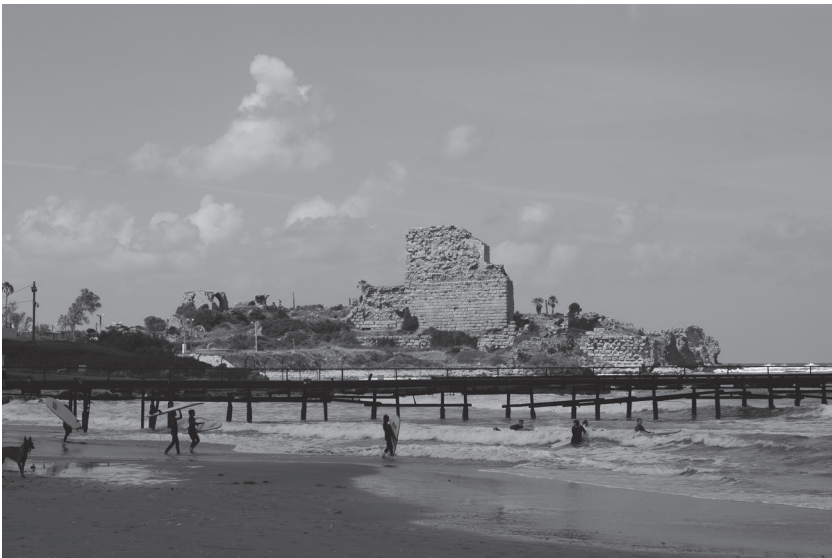
Figuur 1 Atlit of Château Pèlerin.

Aan de buitenzijde van het kasteel merk je er echter niet veel van. We