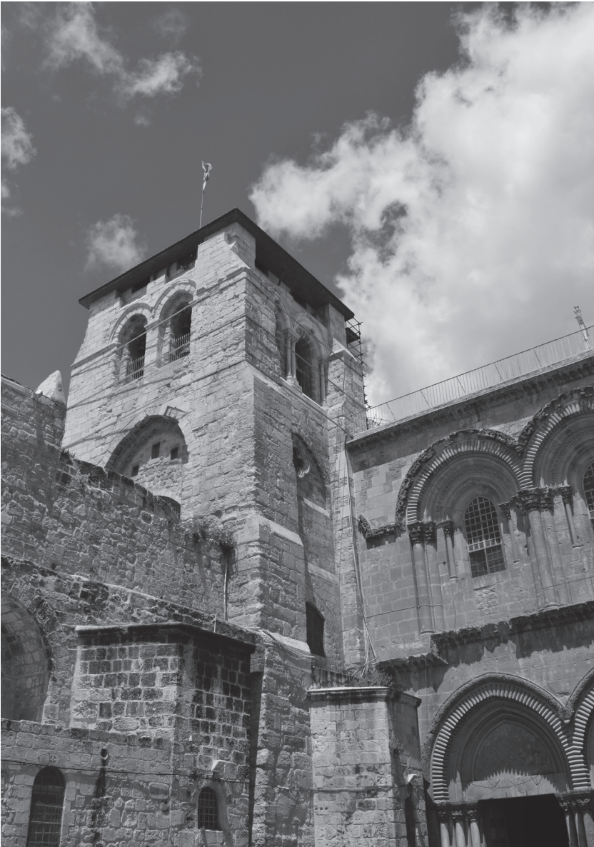
Figuur 6 De Heilige Grafkapel te Jeruzalem.

Tijdens de eerste helft van de twaalfde eeuw werd het gebouw door de Franken verbouwd en uitgebreid tot een imposante romaanse kerk. De Heilige