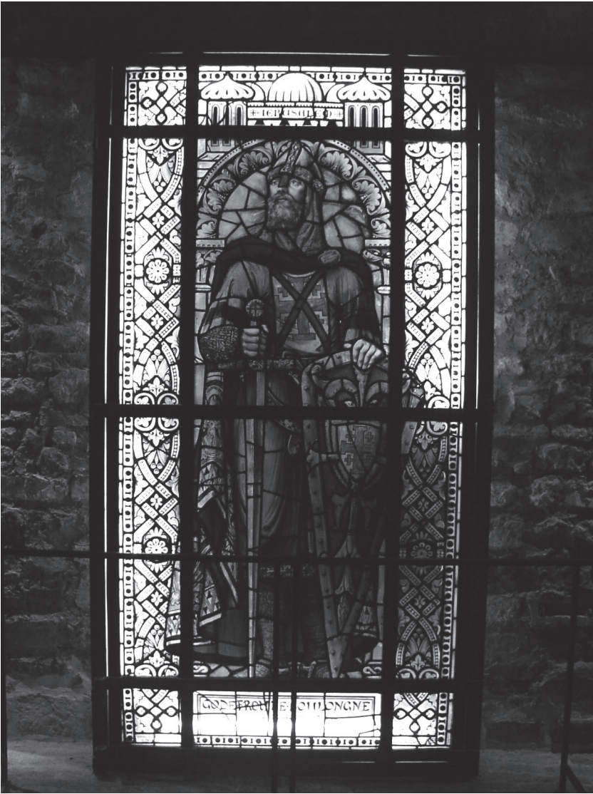
Figuur 5 Godfried van Bouillon, afgebeeld op een glasraam in Boulogne-sur-Mer.

het koninkrijk Jeruzalem, maar om de kruisvaardersstaat te verdedigen en uit te bouwen was er meer nodig. Zijn jongere broer Boudewijn was een