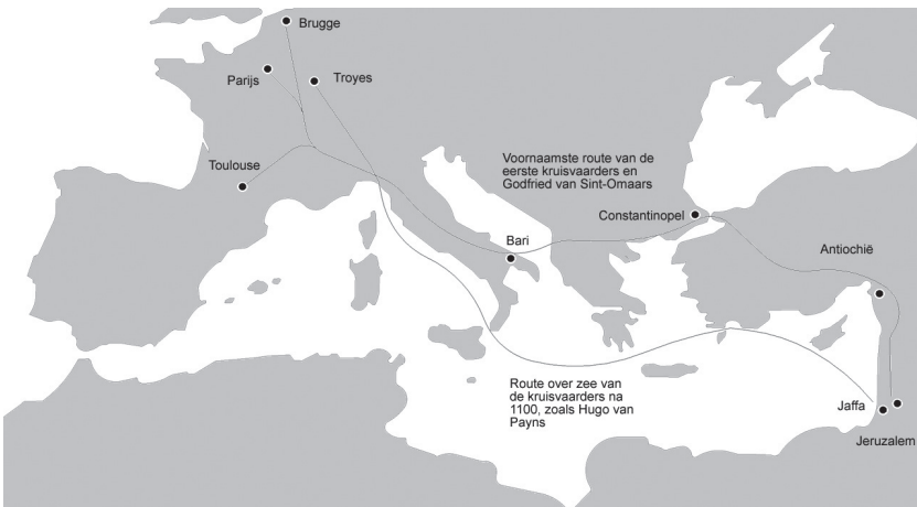
Figuur 3 De Eerste Kruistocht.

de bedenkelijke reputatie van Pieters volgelingen kende, haastte zich om het volksleger zo snel mogelijk aan de overkant van de Bosporus te krijgen, de zee-engte die de Zwarte Zee met de Middellandse Zee verbindt. Alexius' raad om daar op krachten te komen en er te wachten op de komst van het officiële kruisvaardersleger, werd in de wind geslagen. Pieter verloor de controle over zijn volksleger en zag het opsplitsen in twee groepen, die al plunderend steeds dieper Klein-Azië in trokken. De onervaren volkslegers waren een gemakkelijke prooi voor de Turkse sultan. Een voor een werden ze in een hinderlaag gelokt. De ouderen werden afgeslacht en de rest werd als slaven afgevoerd. Alexius stuurde een leger om de overlevenden te ontzetten. Veel hadden de volkskruistochten niet opgeleverd en toen de berichten het thuisfront bereikten, zagen veel christenen hierin een straf voor het uitmoorden van de joden.