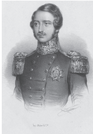
Albert, prins van Saksen-Coburg en Gotha (1819-1861), gemaal van koningin Victoria.

schreef zijn nicht dat al haar ongerustheid terecht was. Dit huwelijk liep niet goed. ‘Niet goed? Het is een regelrechte ramp’, antwoordde Victoria. Als er nu nog eens een paar kindjes geboren werden, dan, ja dan. Maar nageslacht viel er volgens de ervaringsdeskundige de eerstvolgende jaren niet te verwachten.