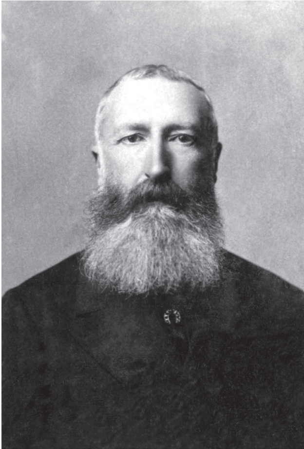
Leopold II (1835-1909), koning der Belgen van 1865 tot zijn overlijden.