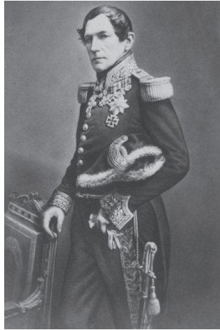
Portret van Leopold I (1790-1865), de eerste koning van België.

we dit kind mogen behouden dat voor België een nieuwe garantie vormt voor orde en stabiliteit, in een land waarin zoveel verschillende belangen elkaar kruisen en bestrijden en dat zo'n behoefte heeft aan orde en standvastigheid. 1 Een levensverhaal dat begon in het ongewisse.