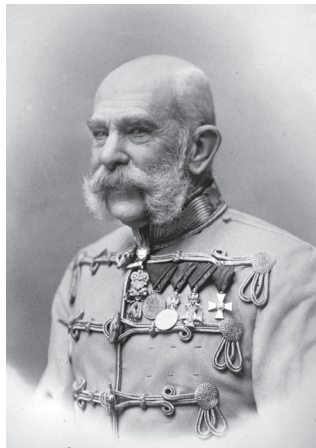
Keizer Frans Jozef van Oostenrijk (1830-1916), in uniform.

strateeg. Hij had Napoleon meegemaakt, was in bijzonder woelige omstandigheden koning van een land geworden waarin velen liever een republiek wilden, en had het Belgische leger geleid toen zijn kersverse België in de zomer van 1831 door de Hollandse troepen overrompeld dreigde te worden bij Leuven. Daarom kende hij als geen ander het belang van sterke internationale banden. Een meester in de internationale diplomatie was hij. Hij had contacten van Londen tot Sint-Petersburg. Als grondwettelijk monarch van een klein land was hij er aardig in geslaagd om dankzij omzichtige diplomatie veel meer gezag, aanzien en geld te verwerven dan zijn bescheiden plaats in de Europese rangorde eigenlijk toeliet. Elke staatsleider respecteerde hem, velen consulteerden hem. Uitgekiende huwelijkspolitiek was zijn handelsmerk. Het was een meevaller dat hij goed kon opschieten met de Weense keizer Franz Joseph. Hij deelde diens maatschappelijke opvattingen, die van de ultraconservatieve, metternichiaanse strekking. Bovendien bood een familiale verbintenis met de Habsburgers betrouwbare bescherming tegen Frankrijk, immer loerend op expansie naar het noorden. Redenen genoeg dus voor de Belgische vorst om een nauwe band met een sterke bondgenoot als Wenen na te streven.