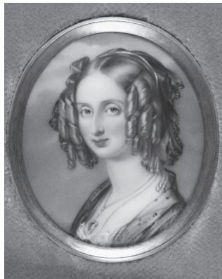
Koningin Louise van België (1812-1850).

aan hun oudste. Intelligent, lief en aanhankelijk, jazekeer. Maar ook zo hol als een leeg vat. Vooral zijn oppervlakkigheid stemde Leopold ongerust. Hij kon weinig bedenken dat hem meer stoorde dan een vadsig karakter. Zeker als het de toekomstige soeverein van zijn land betrof. Helaas zag de Belgische vorst in zijn opgroeiende zoon niet veel meer dan een luiaard. Een grillig en wispelturig onnut aan wie men geen gram kennis kwijt kon. Studeren deed hij niet. Kunst, literatuur en muziek waren evenmin aan hem besteed. Zijn leraars kregen er een punthoofd van. De ouders evenzeer. ‘We hebben hem niets gegeven [voor zijn verjaardag] en we zijn ervan overtuigd dat we hem ook niets meer zullen geven tot hij er eindelijk in slaagt om fatsoenlijk te kunnen lezen’, schreef moeder Louise Marie boos. ‘Want dat leert men hem nu al drie jaar aan en hij staat nog steeds even ver, wat gezien zijn leeftijd waarlijk beschamend is. Een luiaard, dat is hij.’ 9