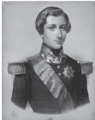
De achttienjarige Leopold.

Iets zeer ongepasts, spotachtigs in haar misnoegde hem. De borstelig ogende hertog van Brabant had bij de eerste kennismaking met de Weense heersers zijn blik meer laten rusten op een andere jongedame. Veel liever was hem Marie Henriettes zus Elizabeth geweest. Die zag er tenminste fris en koket uit, gekleed in een eenvoudige matinee en een rok van grote volants die glad over het korset spande. Zij had iets zeer gewild uitdagends en toch jonkvrouwelijks. Op het voorhoofd en in de hals kroezelden wat fijne lokjes als uitgerafelde zijde. Maar het mocht niet zijn. Elizabeth was vier jaar ouder dan hij en was bovendien weduwe. Not done, zo meende vader Leopold I, die alles besliste. Maar hij nam zijn wensen weer voor werkelijkheid aan. In een brief aan nicht Victoria, die voor het eerst van de verloving hoorde, liet hij weten dat alles prima verliep in Wenen. Marie Henriette was dol op haar aanstaande echtgenoot. Tijdens het diner dansant had ze erop gestaan om naast hem te zitten. Had de koning dan niet in de gaten dat de twee elkaar nauwelijks hadden durven aan te kijken? Ook over zijn zoon was hij lyrisch. Wat een tact en beoordelingsvermogen had die jongen toch! Beter dan veel mannen van veertig. Toegegeven, hij was nog niet helemaal verliefd op zijn aanstaande, maar dat zou wel in orde komen.