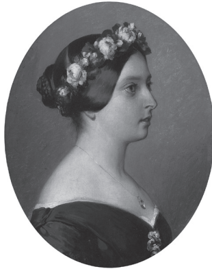
Koningin Victoria (1819-1901) regeerde over het Verenigd Koninkrijk van 1837 tot 1901. Ze was de nicht en vertrouweling van Leopold I. (Olieverf op doek, Franz Xaver Winterhalter, 1844 )

ze aan Marie Henriette duidelijk gemaakt dat er van een getrouwde vrouw enige meegaandheid werd verwacht als het de lichamelijke intimiteit met haar man betrof. Met handen en voeten had ze het uitgelegd. Marie Henriette was helaas niet onder de indruk. Waarom zou ze ook? Het kwam erop neer, zo antwoordde de hertogin, dat ze niet meegaand kon zijn in iets wat niet eens van haar verlangd werd. Met andere woorden: haar echtgenoot had geen zin in haar. Seks met zijn vrouw was een gedachte die niet in hem leefde. Dat pijnlijke feit bleef niet onbestreden. Ook Victoria's man, prins-gemaal Albert van Saksen-Coburg, de neef van Leopold I, ging zich ermee bemoeien. 'Uncle Bertie' hield spreekuur over de bloemetjes en de bijtjes. Daar had niemand hem thuis over ingelicht. Albert trachtte de negentienjarige Leo aan het verstand te brengen dat er meer inspanningen van hem verwacht werden. Ter verduidelijking van zaken nam Albert hem op sleeptouw in het nachtleven. Een bordeelbezoek, om het in duidelijke taal te zeggen. Maar wat zich in het leven nu eenmaal nooit laat afdwingen, is liefde. Hoe deskundig het Britse vorstenpaar ook zijn mocht, hun kennis van zaken kregen ze maar niet verkocht aan de Belgische zuurpruimen. Victoria meldde het aan haar oom