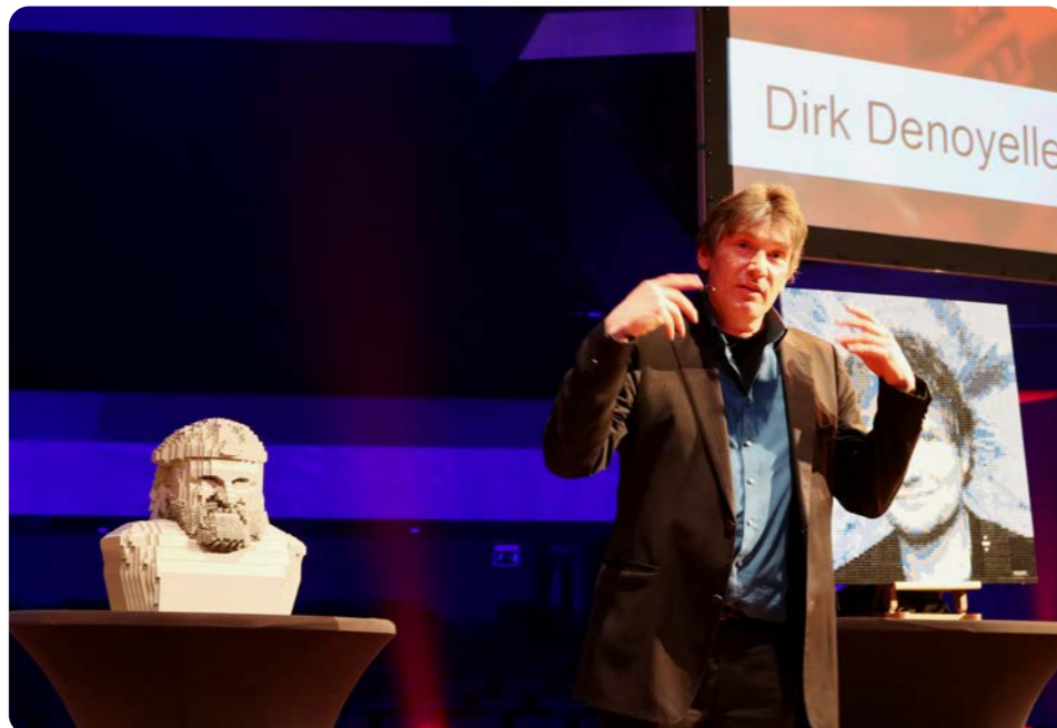
Tijdens een motivational speech in Breda

Intussen zal het jou, beste lezer, hopelijk niet ontgaan zijn dat ik beide dromen heb kunnen waarmaken. In zoverre zelfs dat het een van mijn slagzinnen is tijdens de motivational speeches die ik geef: maak van je hobby's je beroep – make your dreams come true . Dromen hoeven echt geen bedrog te zijn: als je het goed aanpakt en zelf in de hand neemt, kan je ze laten uitkomen.