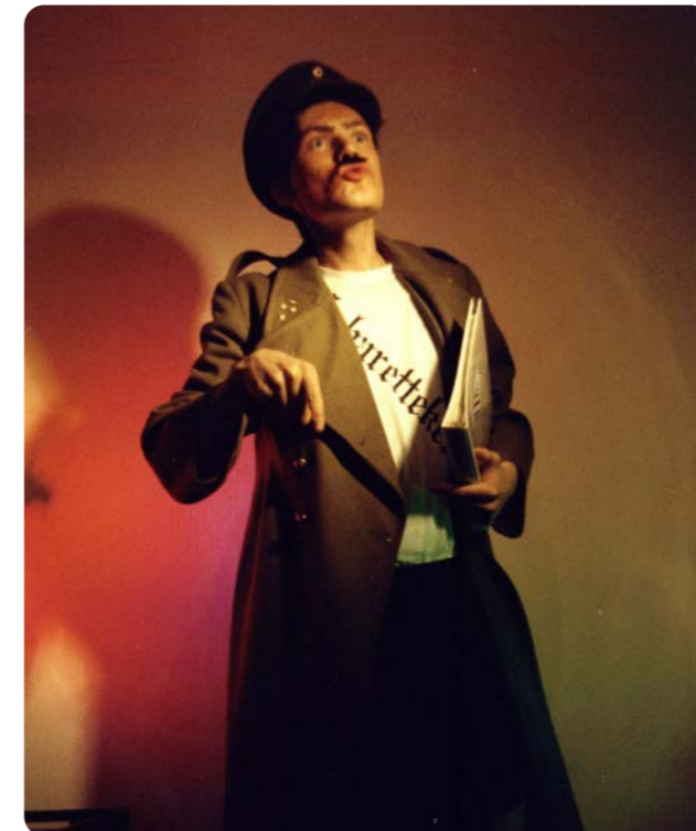
Als jonge twintiger in een sketch over de militaire dienstplicht