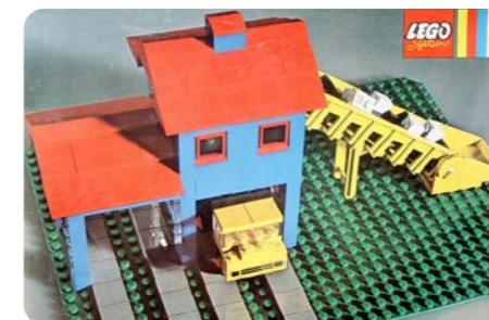
Een van mijn favoriete sets, nummer 351

In het LEGO wereldje heb je trouwens verschillende types bouwers: zij die graag iets bouwen volgens een plan, zij die graag hun eigen fantasie uitleven, en zij die vooral willen spelen met wat ze gebouwd hebben. Ik heb een beetje van alle drie. Ik mengde de bestaande sets met mijn eigen bouwsels, en dan kwamen de verhalen. Bandiet ontsnapt en de politie moet hem vangen. Daarbij vloog er natuurlijk iets in brand, moesten de ziekenwagens uitrukken, ontspoorde de trein (die meestal op een zelfgemaakte brug boven de stad uittorende)... Je kent dat wel. Mijn grote held was