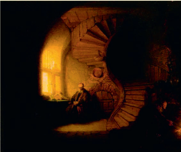
De filosoof, Rembrandt (1632)

Filosofie komt van het Griekse filein en sophia . Filein betekent 'houden van', de term sophia verwijst naar de Griekse godin van de wijsheid. Dat wijsheid vrouwelijk was in een wereld die bijna volledig bevolkt werd door mannen, mag een verrassing lijken. Of toch weer niet? Men spreekt immers van vrouwelijke intuïtie, hiermee verwijzend naar de directe ervaring van waarheid, zonder een beroep te doen op een redeneerproces. Of dit klopt, valt sterk te betwijfelen en is voer voor psychologen. Het enige dat hier duidelijk mag gesteld worden, is dat een geschiedenis van de filosofie een verhaal is van mannen. Vanaf de twintigste eeuw is daarin flink verandering gekomen, omdat vrouwen toen pas op een vergelijkbare manier als mannen toegang kregen tot onderwijs.