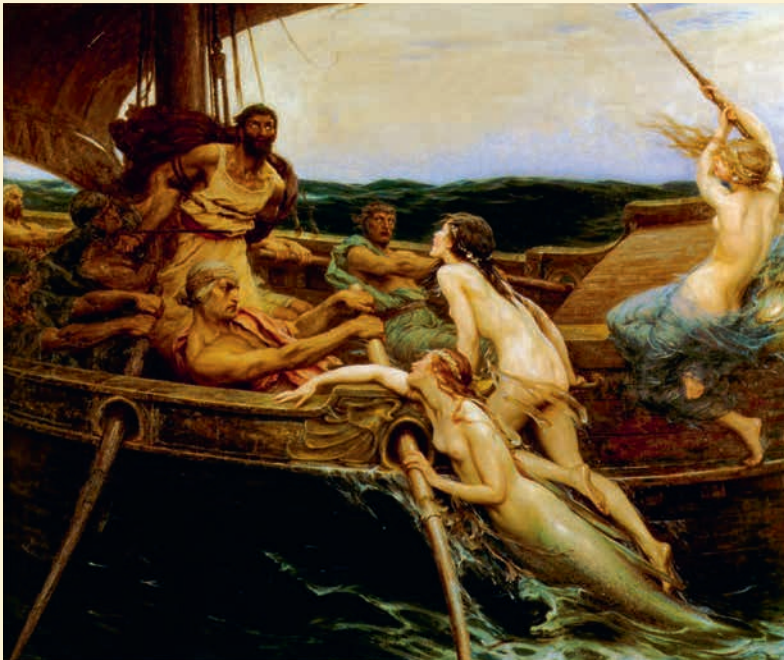
Odysseus en de sirenen , Herbert Draper (1910)

De terugkeer van Odyseus naar zijn thuis kan dan weer gelezen worden als de weg die de mens aflegt in het leven om zichzelf terug te vinden, tegen alle verlokkingen van het leven in.