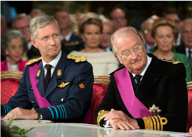
De relatie tussen Filip en zijn vader, met heel verschillende karakters, was en is vaak problematisch.