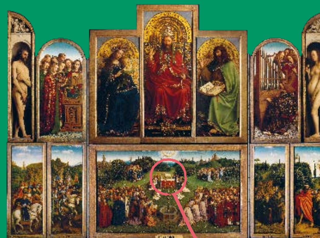
de Rechtvaardige Rechters

'Ik doe het alvast niet voor het geld, al zou ik met het vindersloon wel een aantal nieuwe stevige boekenkasten kunnen kopen. Nee, het werk van onze voorname voorvader behoort na al die jaren opnieuw compleet te zijn.' Geamuseerd leest hij de verbazing van mijn gezicht af. 'Dat wist je nog niet, hé? Kijk maar eens goed je ogen uit.' Zijn vinger wijst naar het portret van de strenge man boven de schouw. 'Deze Jan van Eyck, de beste schilder ooit in ons land, is niemand minder dan jouw voorvader.'