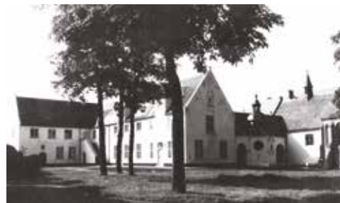
De Sint-Godelieveabdij 'Ten Putte' in Gistel.