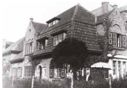
Het ouderlijk huis in Brugge.