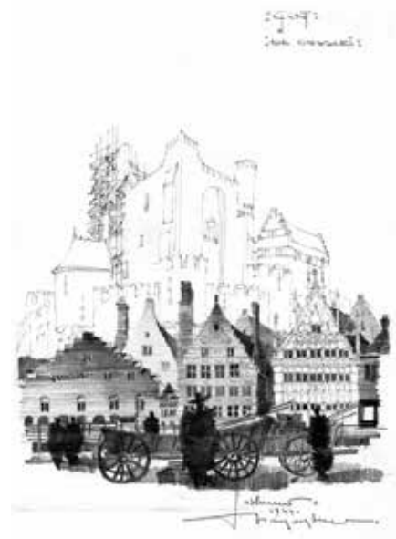
Een tekening uit 1944 van de Graslei in Gent.