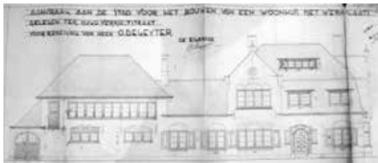
Het plan van het ouderlijk huis in Brugge, getekend in 1937.