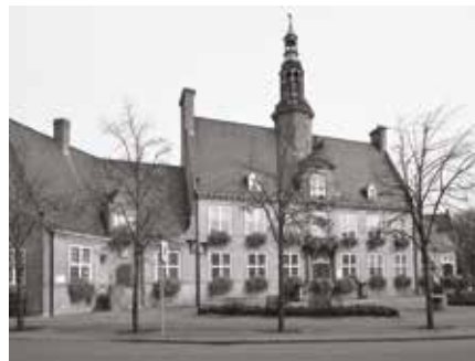
Het stadhuis van Oostduinkerke.