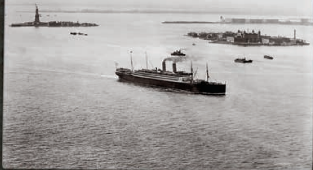
New York. Ellis Island. Neg No. 27034