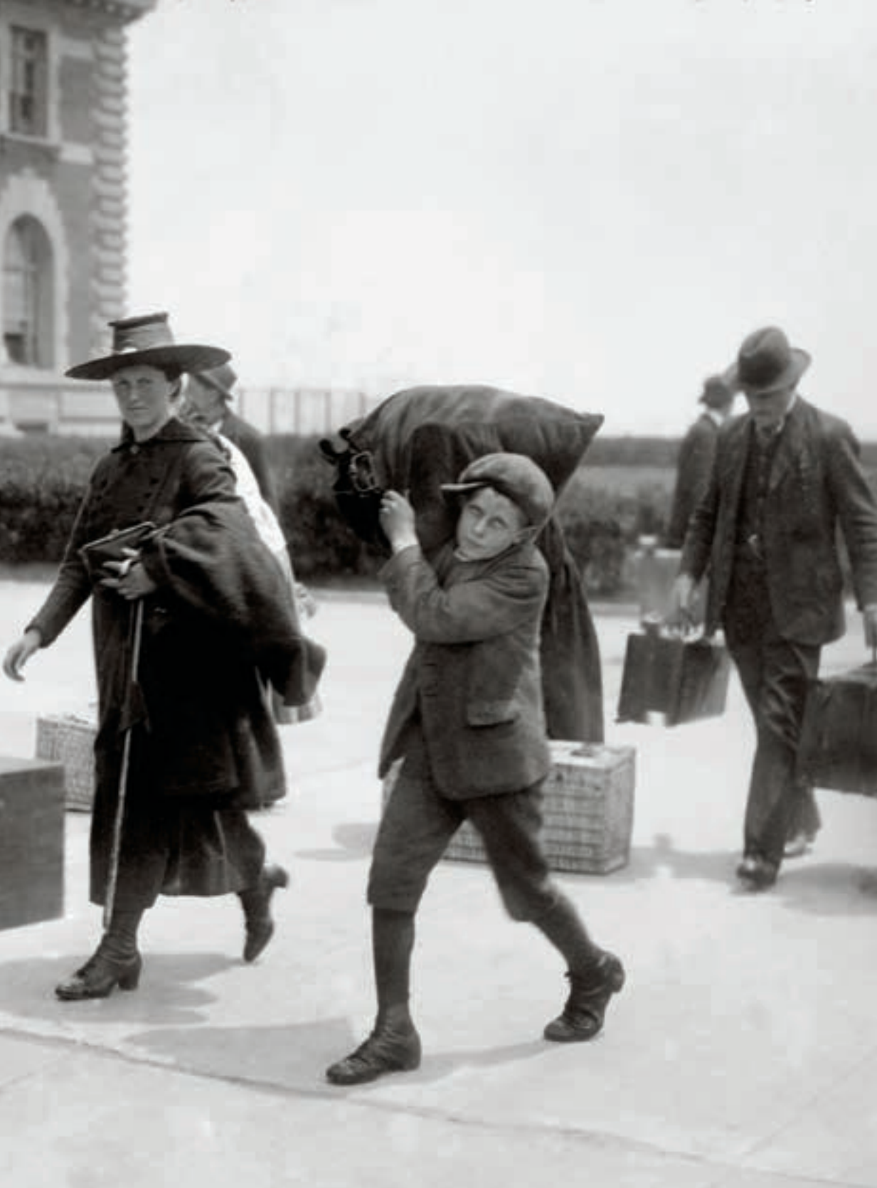
ARRIVING AT ELLIS ISLAND 5202