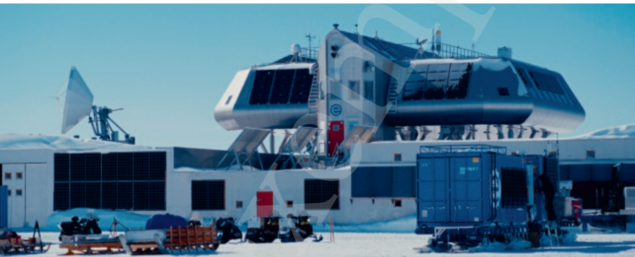
De Prinses Elisabethbasis op Antarctica.