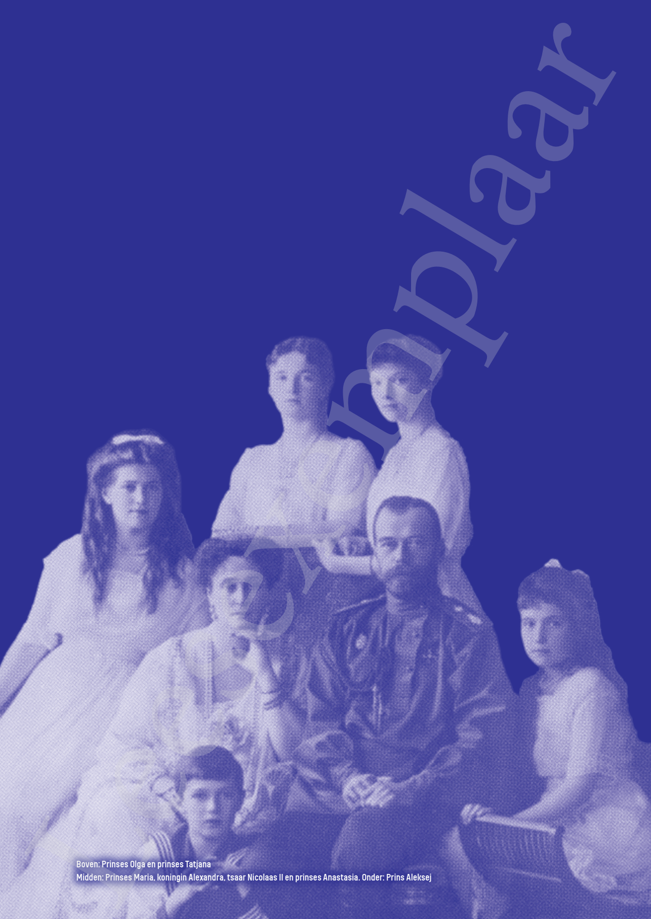
Boven: Prinses Olga en prinses Tatjana