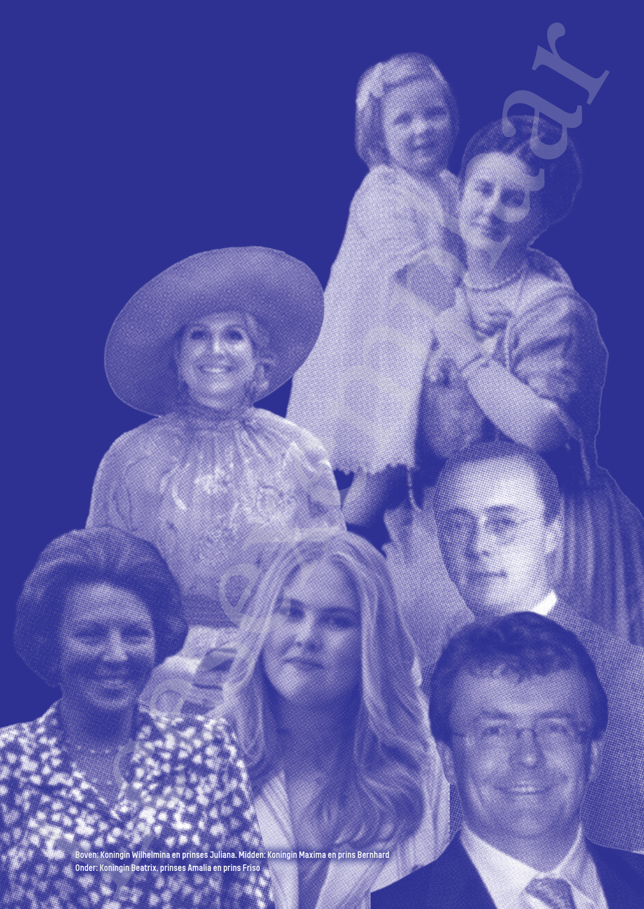
Boven: Koningin Wilhelmina en prinses Juliana. Midden: Koningin Maxima en prins Bernhard Onder: Koningin Beatrix, prinses Amalia en prins Friso