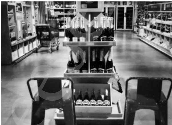
Geen toegang tot de sterke drank in de supermarkt.

Maar goed, zo één glaasje van iets meer dan 40 graden 's avonds, dat lukt nog wel. Op de vrede.