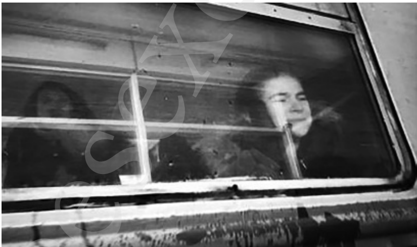
Vrouw neemt afscheid van haar achterblijvende echtgenoot op het passagierstreinstation van Kyiv.

De Oekraïners zijn hier trouwens zeer onder de indruk van de hulpacties die bijvoorbeeld in Vlaanderen worden opgezet. Ze appreciëren dat er hulpgoederen worden gestuurd. En als ik op mijn telefoon foto's toon van de Oekraïense vlag op het gemeentehuis van mijn woonplaats Boechout, komen er meteen vijf tot zelfs twintig Oekraïners blij kijken. Prachtig. De mensen steunen ons, dat is ons meer waard dan wat de politici bekokstoven.