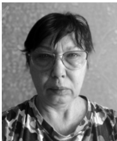
Een gezicht van de oorlog.