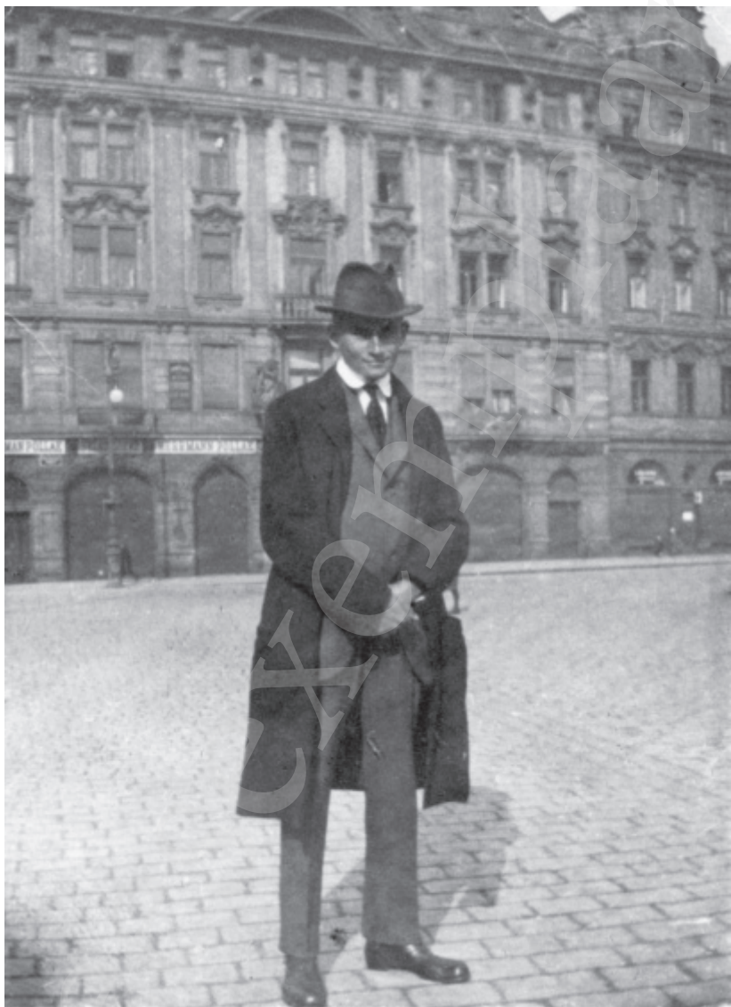
Kafka op de Altstädter Ring in Praag, rond 1922