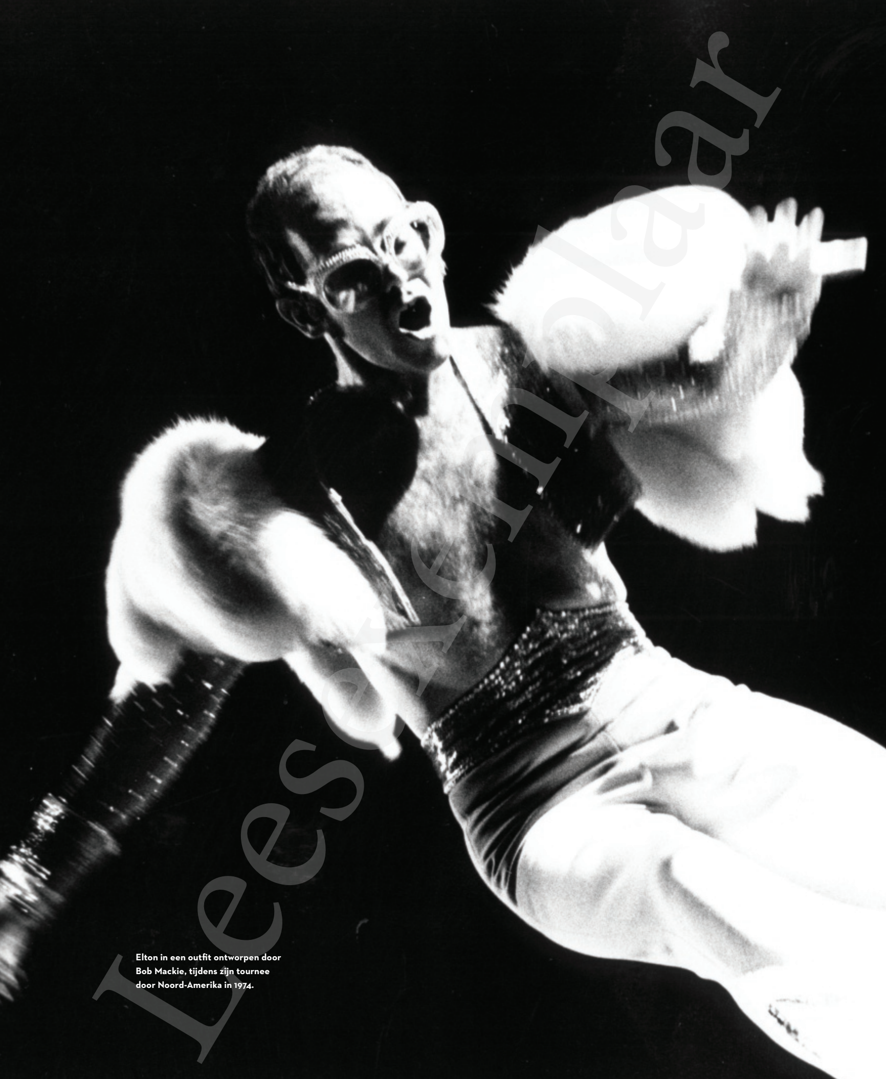
Elton in een outfit ontworpen door Bob Mackie, tijdens zijn tournee door Noord-Amerika in 1974.