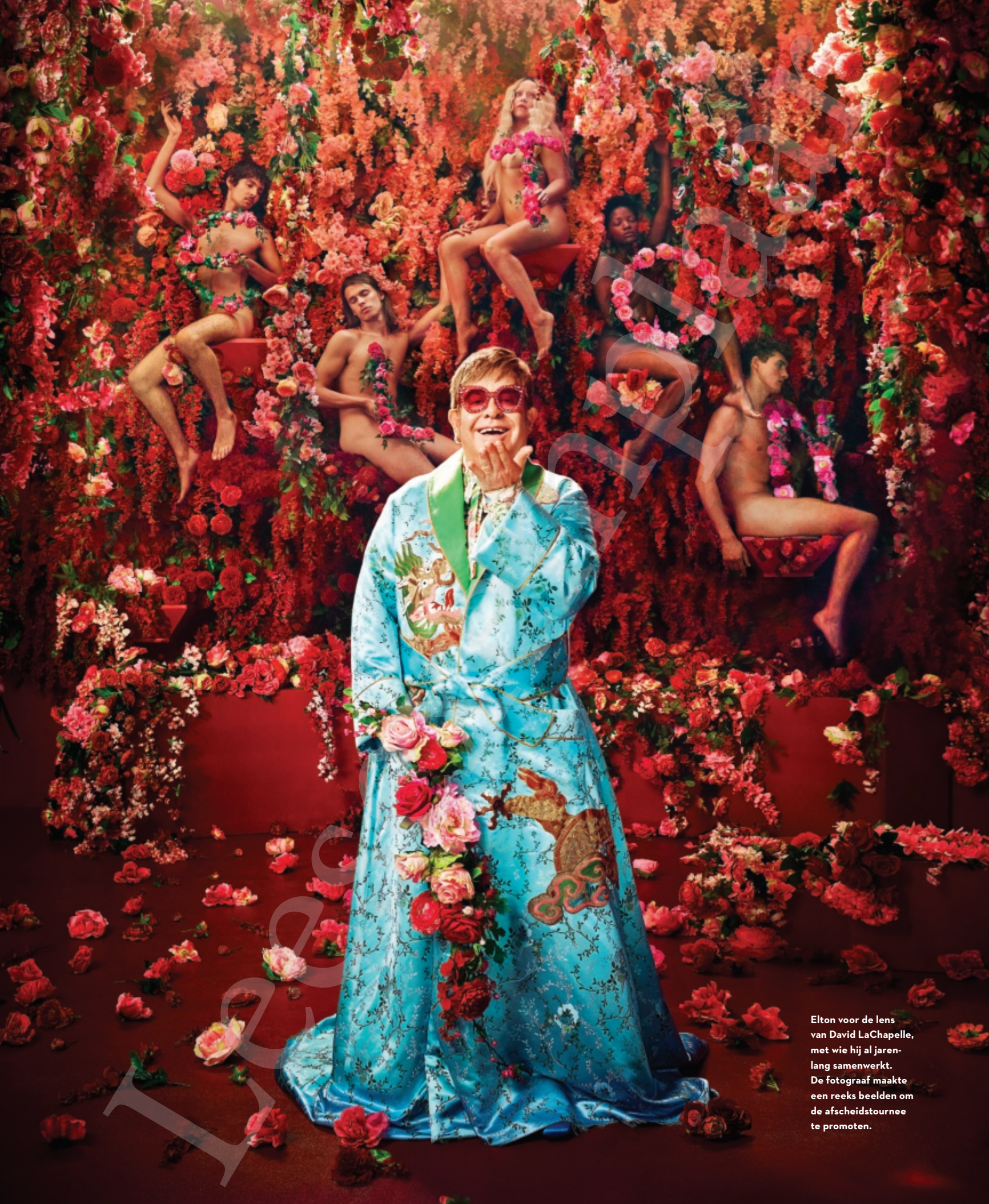
Elton voor de lens van David LaChapelle, met wie hij al jarenlang samenwerkt. De fotograaf maakte een reeks beelden om de afscheidstournee te promoten.