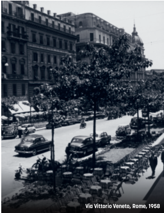
Via Vittorio Veneto, Rome, 1958