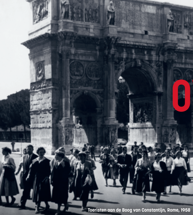
Toeristen aan de Boog van Constantijn, Rome, 1958