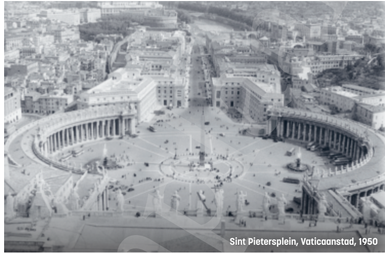
Sint Pietersplein, Vaticaanstad, 1950