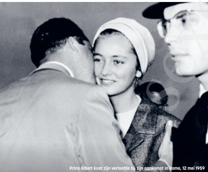
Prins Albert kust zijn verloofde bij zijn aankomst in Rome, 12 mei 1959