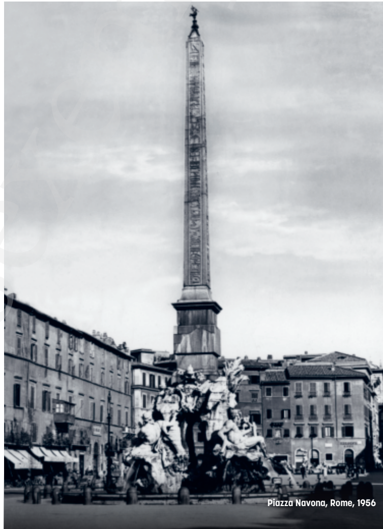
Piazza Navona, Rome, 1956