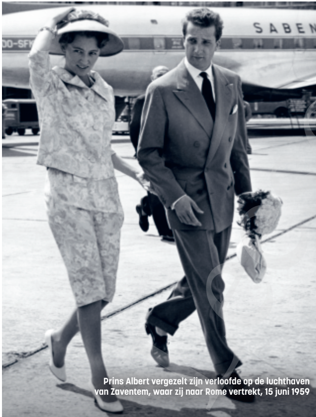
Prins Albert vergezelt zijn verloofde op de luchthaven van Zaventem, waar zij naar Rome vertrekt, 15 juni 1959

De romance blijft geheim tot de officiële aankondiging op 12 april 1959. Die dag begint op alle Belgische kranten- en weekbladenredacties de jacht naar nieuws over Alberts uitverkorene. Zij blijkt deel uit te maken van een der oudste adellijke geslachten van Europa dat het oude Rome consuls en pretoren schonk en waartoe ook de vrouw van Julius Caesar behoorde. Een andere roemrijke telg, Cornelius, laat zich tot het christendom bekeren en wordt als Cornelius Rufus de eerste paus van de vroege kerk. De Italiaanse geschiedenis is geplaveid met illustere Ruffo's: krijgers, prelaten, dichters, prinses, hertogen, graven en mecenasen. In de twintigste eeuw raken de Ruffo's, ondanks hun optimistische wapenspreuk Omnia Bene , Alles gaat goed, de meeste van hun bezittingen kwijt. Een droeve vaststelling in de wetenschap dat de familie in de elfde eeuw tot de machtigste huizen van Napels behoorde en tot diep in de twaalfde eeuw de plak zwaaide over Calabria, de zuidwestelijke teen van de voet van Italië. Hun naam, titels en voorrechten zijn ze blijven bewaren. Dat is ook de reden dat de jonge Paola uitgenodigd is op de kroning van de paus en Albert op de receptie ontmoet.