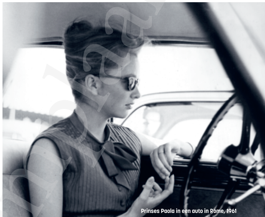
Prinses Paola in een auto in Rome, 1961