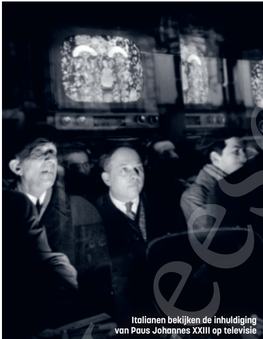
Italianen bekijken de inhuldiging van Paus Johannes XXIII op televisie