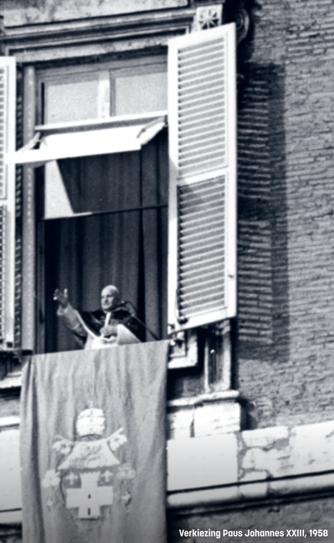
Verkiezing Paus Johannes XXIII, 1958