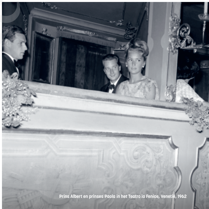
Prins Albert en prinses Paola in het Teatro la Fenice, Venetië, 1962