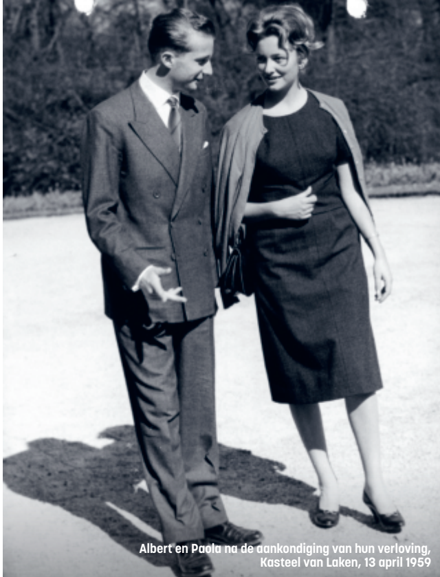
Albert en Paola na de aankondiging van hun verloving, Kasteel van Laken, 13 april 1959