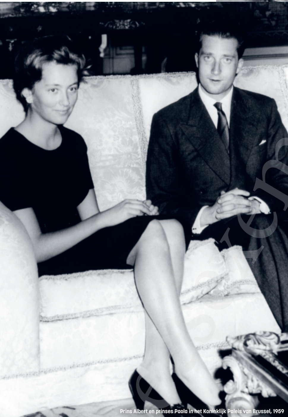
Prins Albert en prinses Paola in het Koninklijk Paleis van Brussel, 1959