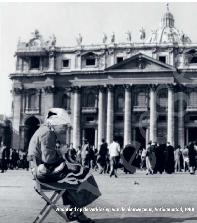
Wachtend op de verkiezing van de nieuwe paus, Vaticaanstad, 1958