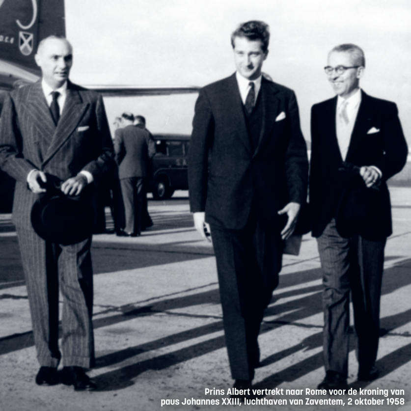
Prins Albert vertrekt naar Rome voor de kroning van paus Johannes XXIII, luchthaven van Zaventem, 2 oktober 1958