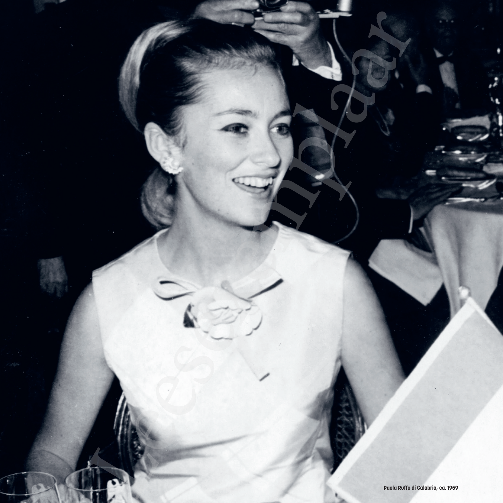
Paola Ruffo di Calabria, ca. 1959